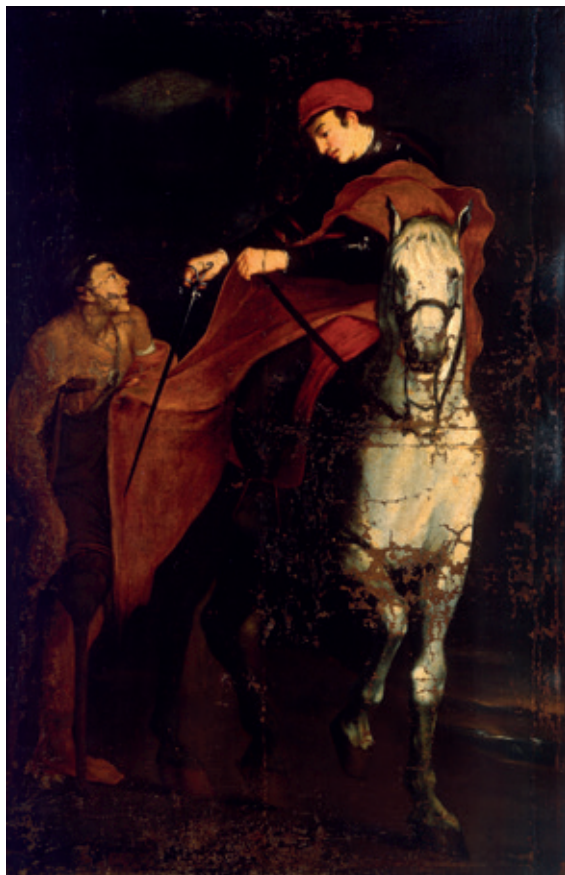
Figura 13.–José de Ribera, San Martino e il povero , Parma, Galleria Nazionale.