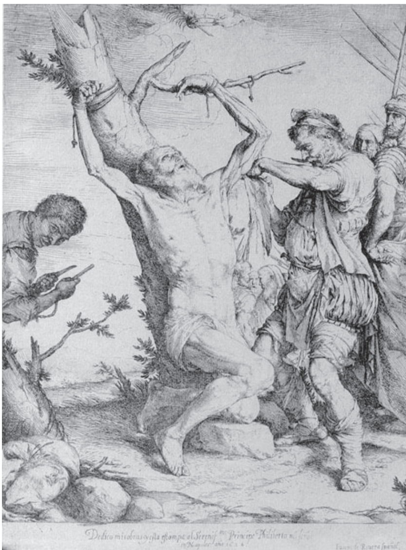
Figura 11.—José de Ribera, Martirio de San Bartolomé , 1624.