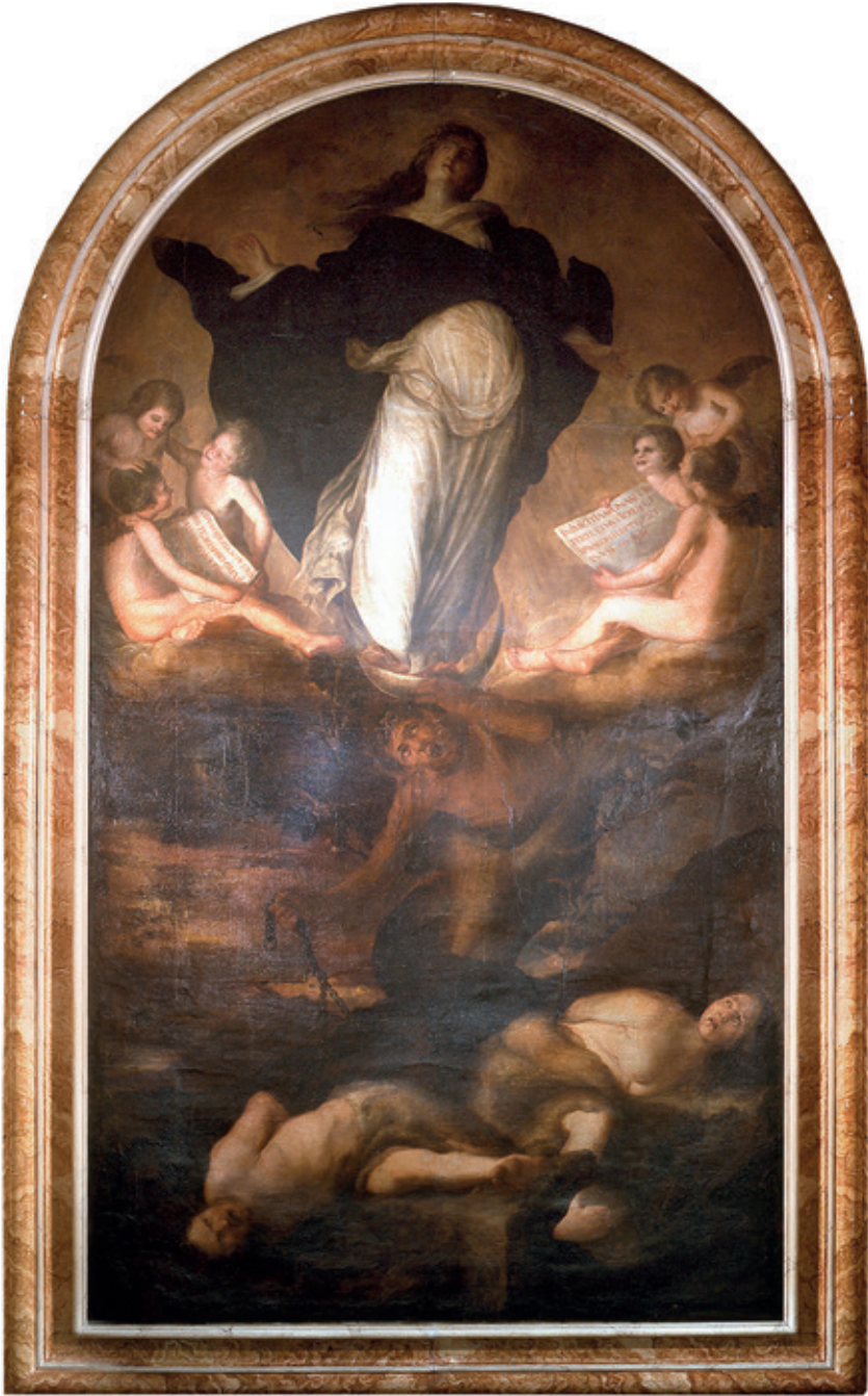
Figura 1.–Sebastián Martínez. Inmaculada , ca. 1650, Jaén, Santa Iglesia Catedral (procedente de la iglesia de Santa Cruz).