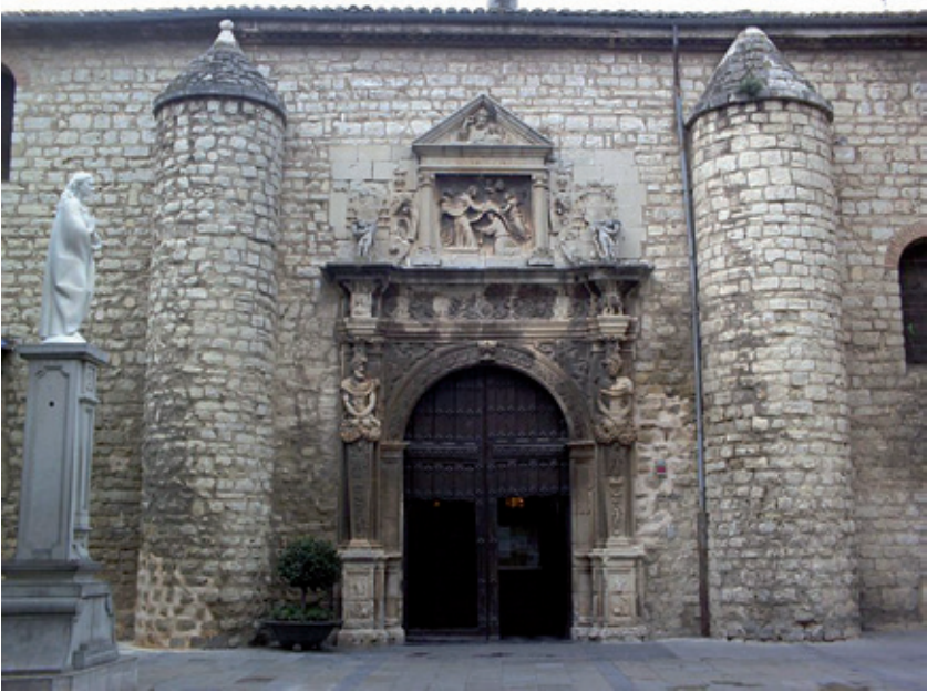
Figura 4.-Parroquia de San Ildefonso de Jaén, portada norte.