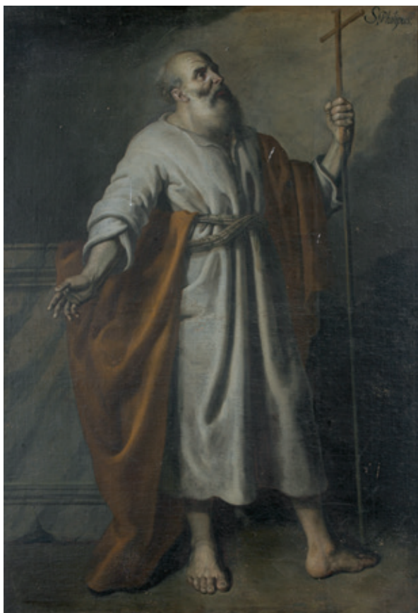
Figura 22.–Sebastián Martínez, comparación de la cabeza de San Felipe del Apostolado de Córdoba con la quinta del dibujo del Museo Nacional del Prado.