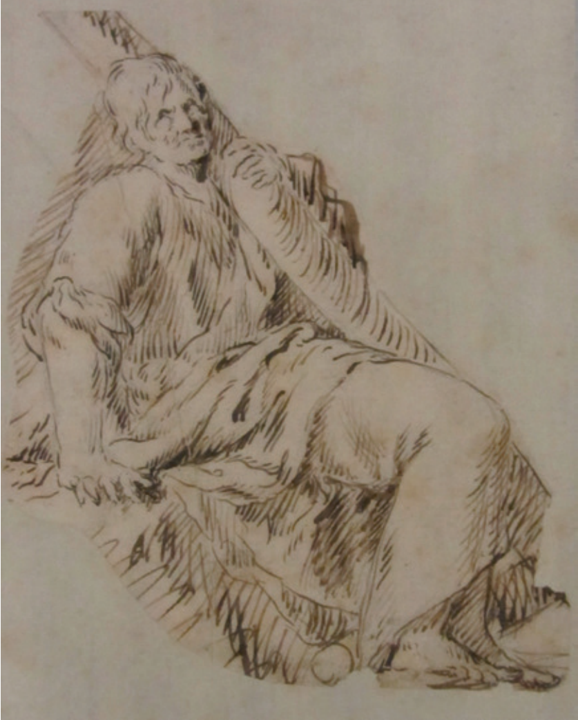
Figura 4.–Sebastián Martínez Domedel, San Andrés , pluma de caña de tinta parda con trazos de lápiz negro sobre papel verjurado, 223 x 175 mm, Florencia, Uffizi, Gabinete de dibujos y estampas, invº n.º 6775S.