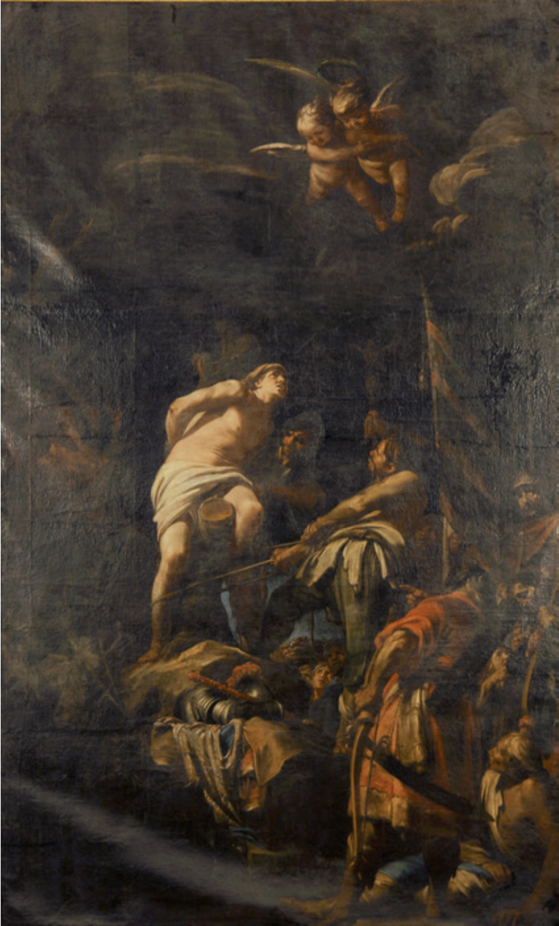
Figura 15.-Sebastián Martínez, Martirio de San Sebastián , 1663, Jaén, Santa Iglesia Catedral.