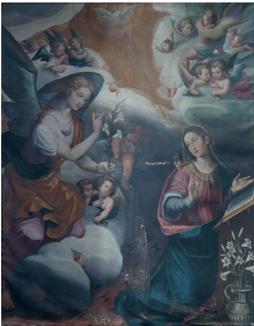
Figura 6.-Juan Esteban de Medina, Anunciación , Baeza (Jaén), Santa Iglesia Catedral.