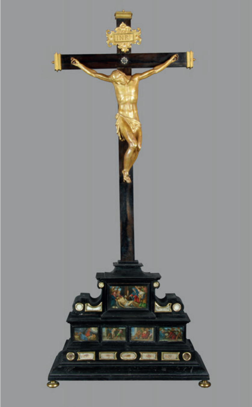
Figura 6.–Seguidor de Guglielmo della Porta, Crucificado-Relicario , ca. 1615, Jaén, Santa Iglesia Catedral.