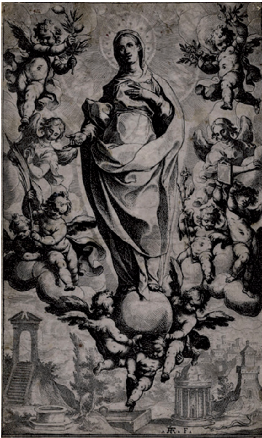
Raffaello Schiaminossi, Inmaculada , 1603.