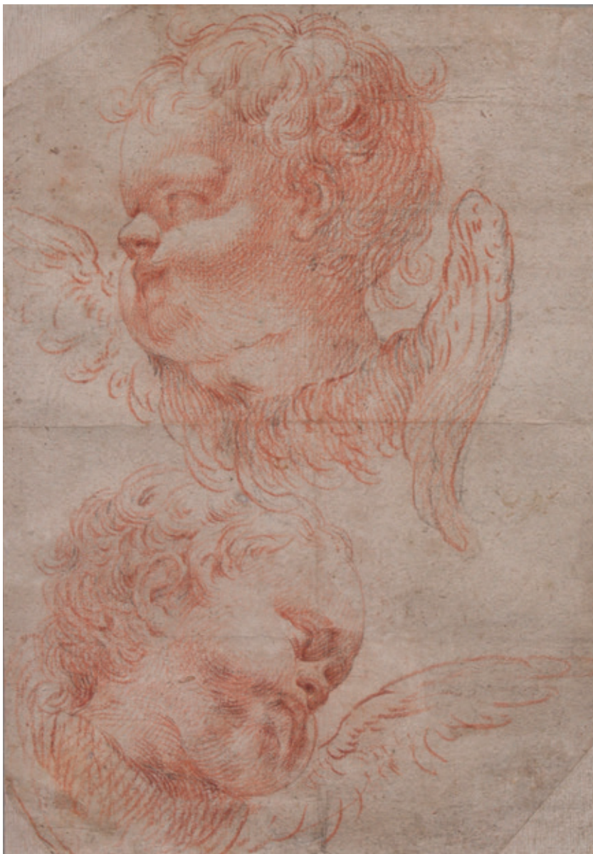
Figura 4.-Cristóbal Vela Cobo (aquí atribuido), Dos cabezas de querubes , grafito y sanguina sobre papel, Córdoba, Museo de Bellas Artes. N° de inventario: CE1030D.