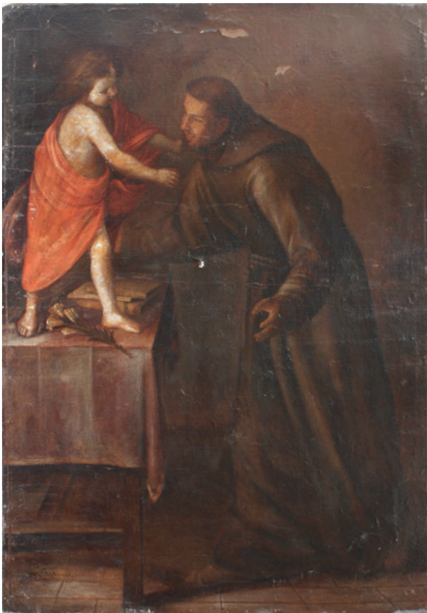
Figura 5.–Sebastián Martínez, Visión de San Antonio , 176 x 122 cm, ca. 1655, Poblet (Tarragona), Museo del Monasterio de Santa María.