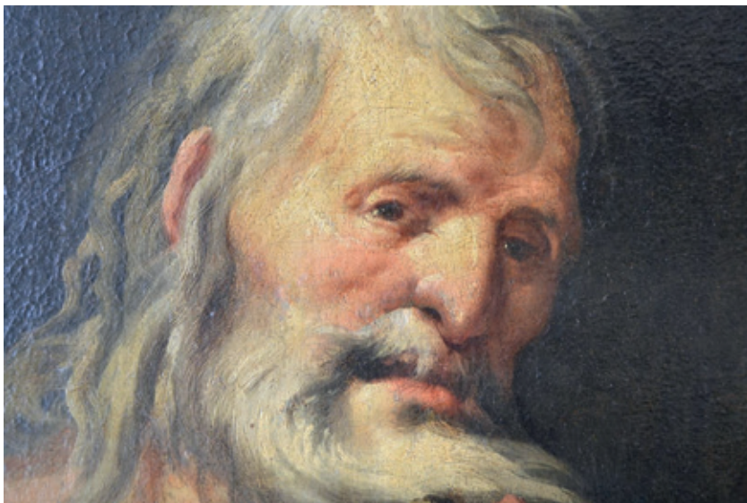
Figura 7.1.–Sebastián Martínez Domedel, detalle de la cabeza de Adán en La muerte de Abel , Ginebra, Hôtel des Ventes.