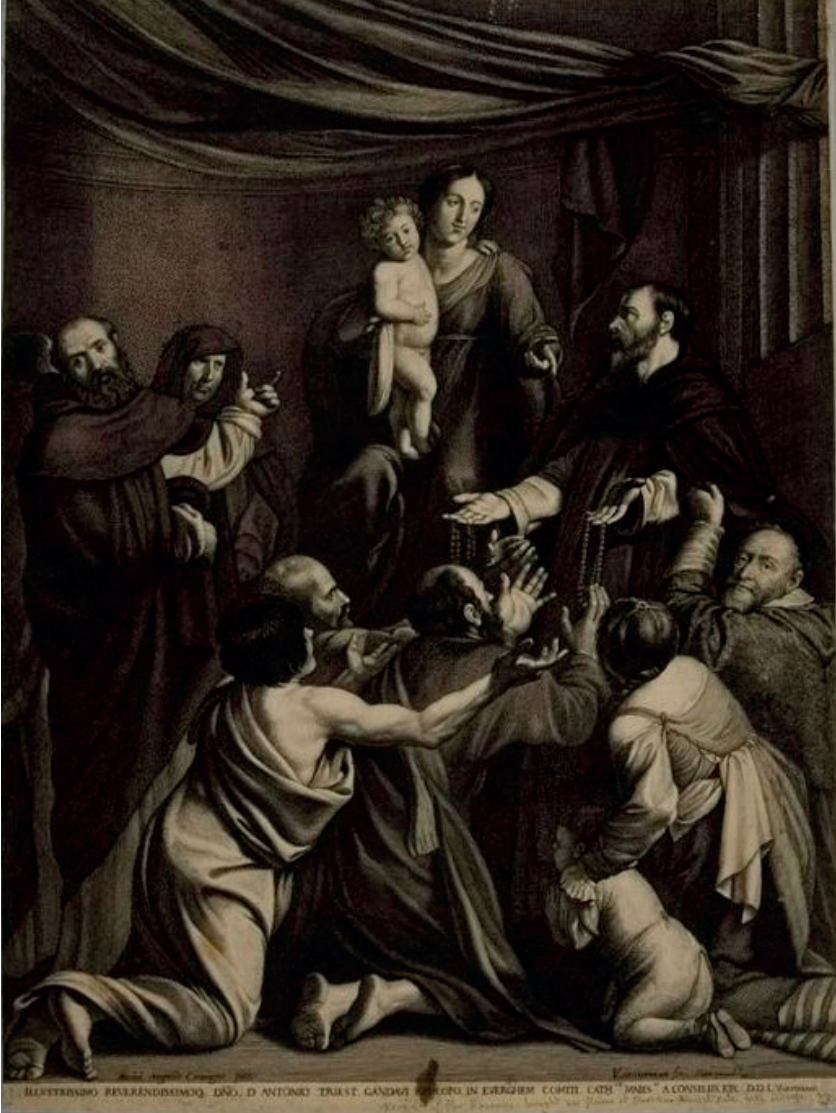
Figura 18.—Lucas Vorsterman (1595-1675), Virgen del Rosario con dominicos según Caravaggio.