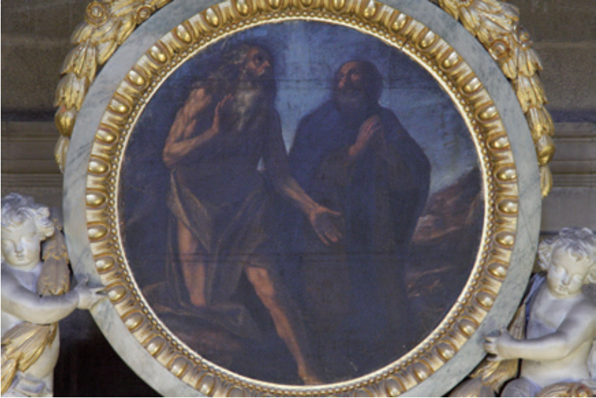
Figura 9.–Sebastián Martínez (atribuido), Santos Pablo y Antonio Abad , ca. 1650, Jaén, Santa Iglesia Catedral.