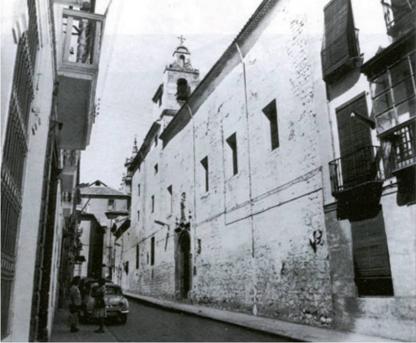
Figura 3.—Antiguo Monasterio de la Concepción Dominica de Jaén.