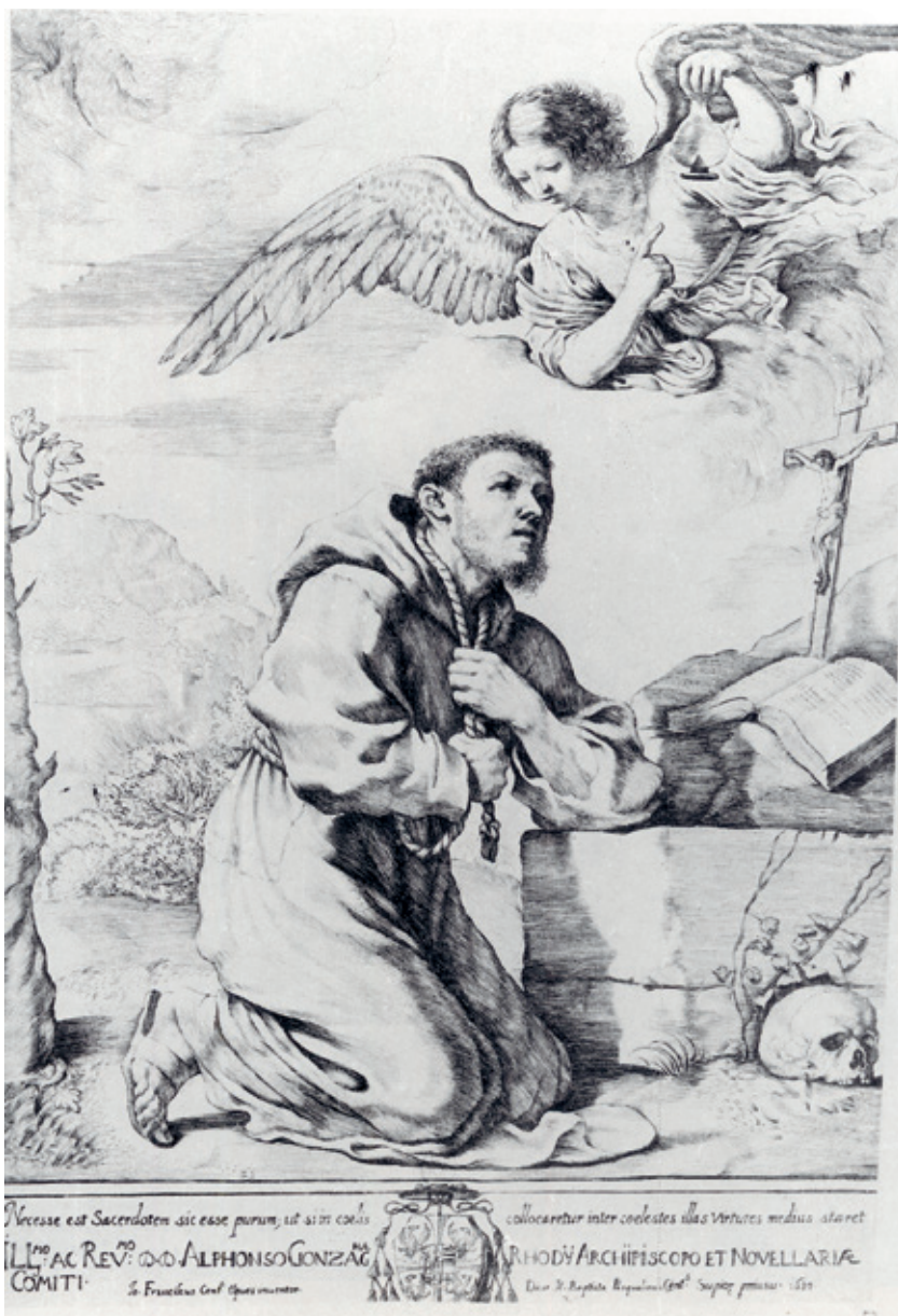
Figura 16.–Giovanni Battista Pasqualini, San Francisco recibiendo la redoma , Bolonia.