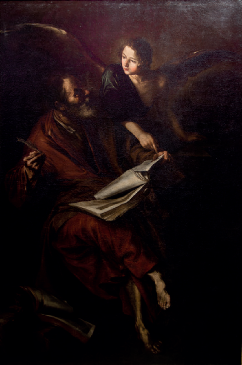
Figura 2.—Sebastián Martínez, San Mateo , ca. 1655, Jaén, Santa Iglesia Catedral.