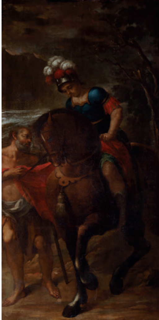
Figura 12.–Sebastián Martínez, San Martín partiendo la capa a un pobre , Córdoba, Iglesia de San Nicolás de la Villa.