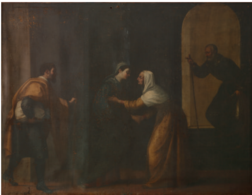
Figura 3.–Cristóbal Vela Cobo, Visitación , Córdoba, Monasterio de Santa Isabel.