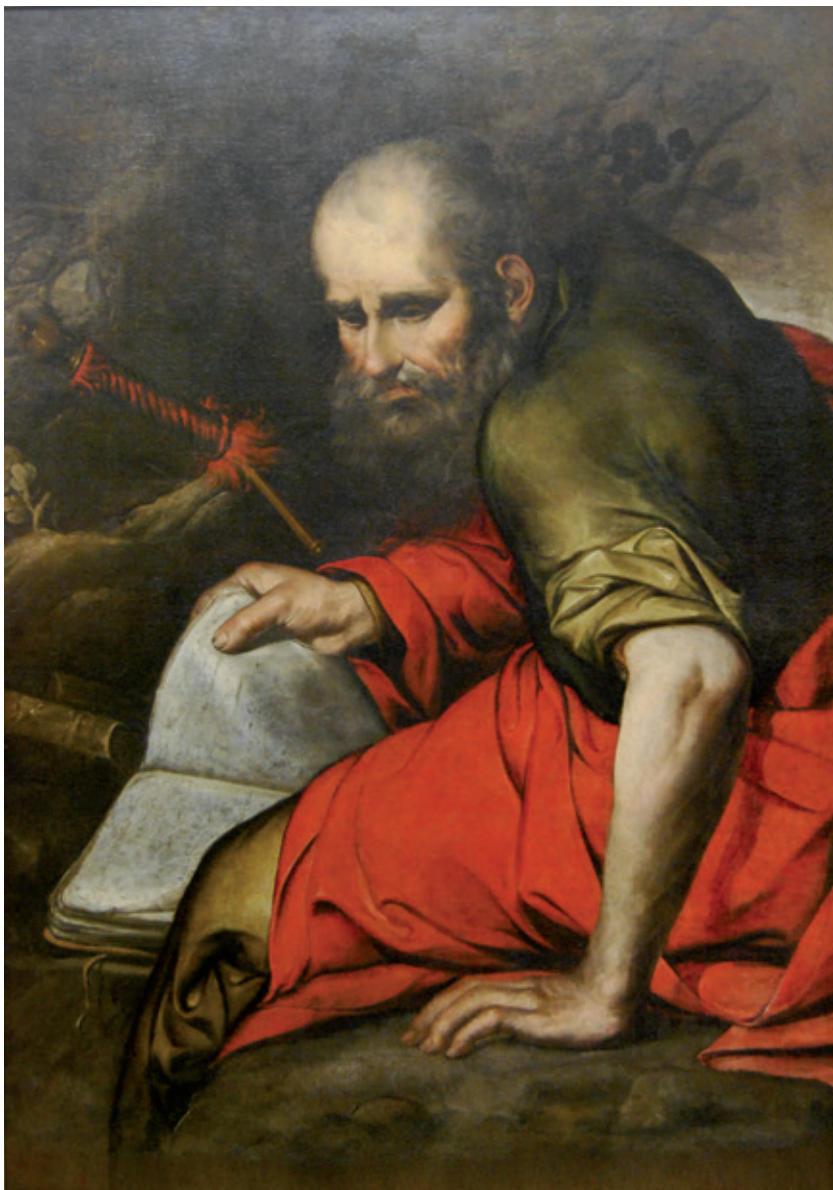
Figura 7.-Sebastián Martínez (aquí atribuido), San Pablo , Córdoba, Museo de Bellas Artes. Nº de inventario: CE2095P.