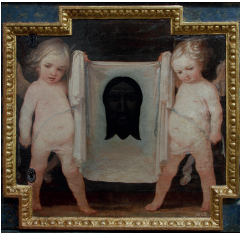
Figura 12.—Sebastián Martínez Domedel, El Santo Rostro sostenido por ángeles , ca. 1661, Jaén, Santa Iglesia Catedral.