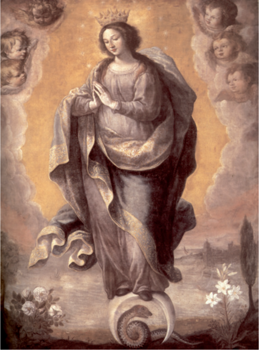
Figura 5.–Cristóbal Vela Cobo, Inmaculada Concepción , Córdoba, Santa Iglesia Catedral.