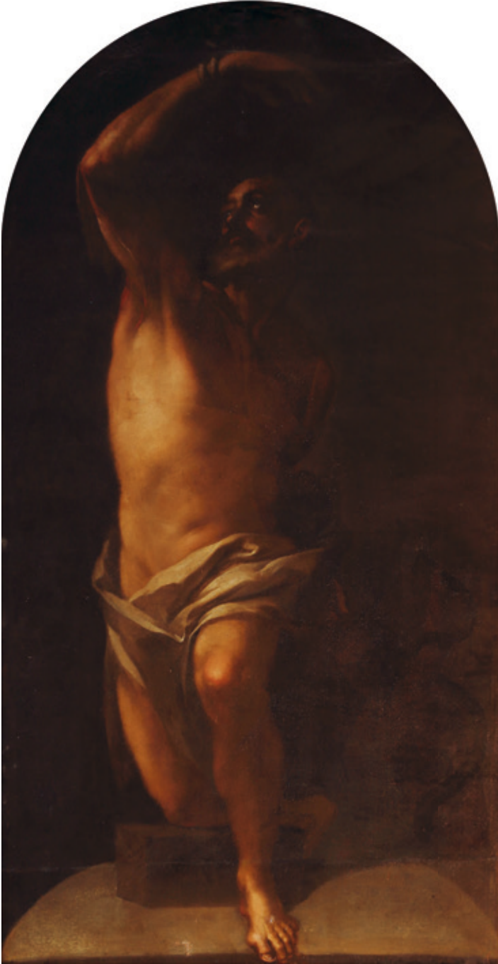
Figura 10.—Sebastián Martínez, San Bartolomé en el caldoso de su martirio , Córdoba, Iglesia de San Nicolás de la Villa.