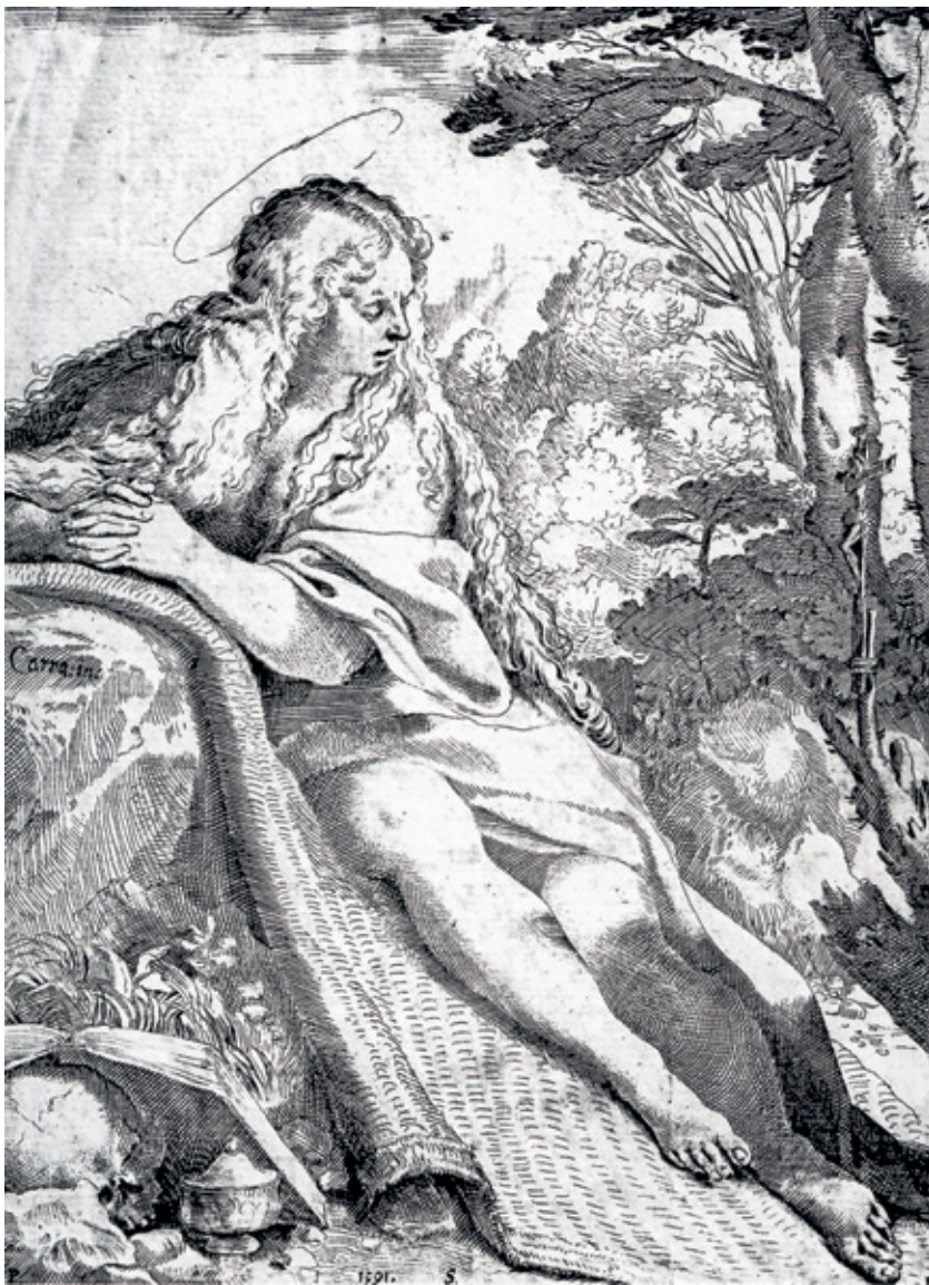
Figura 19.-Annibale Carracci, Magdalena penitente , Bolonia. © Pinacoteca Nazionale.