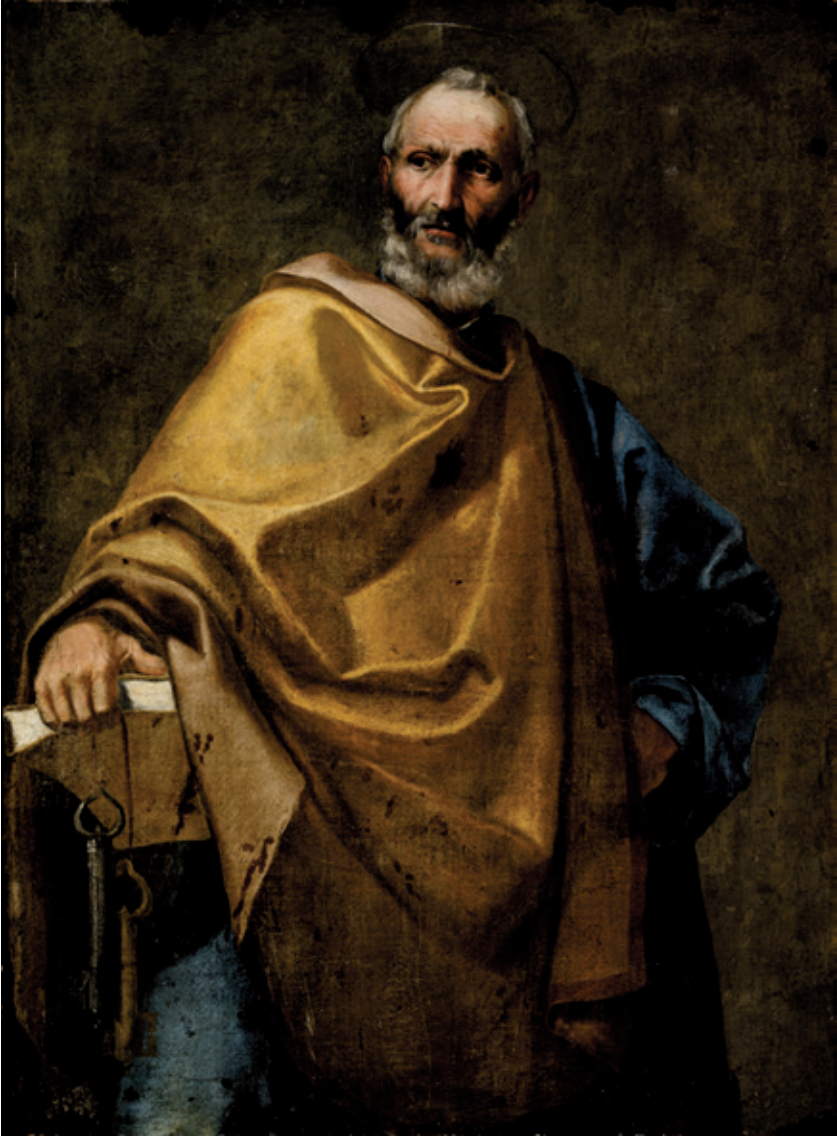
Figura 1.-Sebastián Martínez Domedel, San Pedro , 130 x 96 cm, ca. 1645, Dinamarca, colección privada.