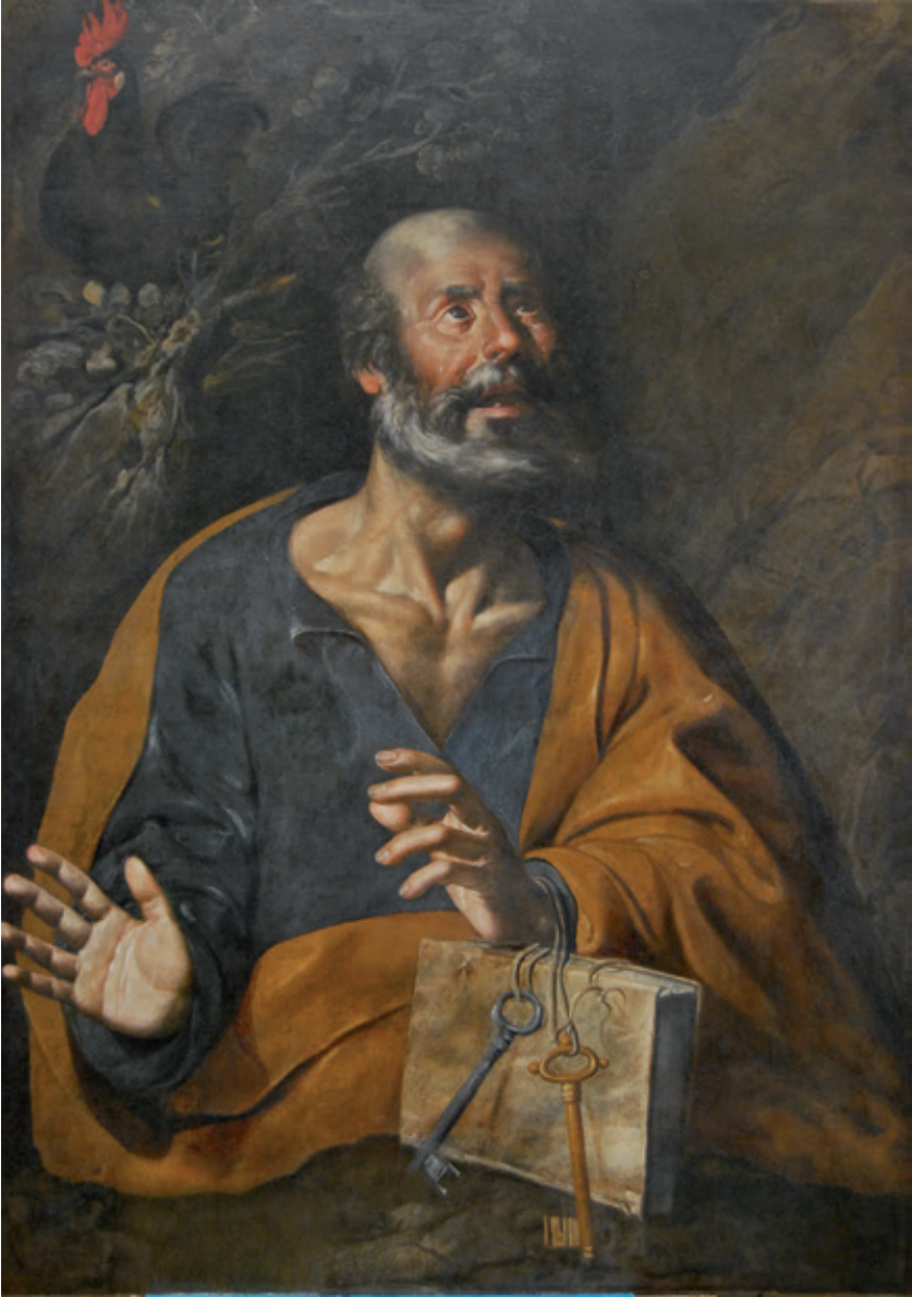
Figura 6.–Sebastián Martínez (aquí atribuido), San Pedro , Córdoba, Museo de Bellas Artes. Nº de inventario: CE2096P.