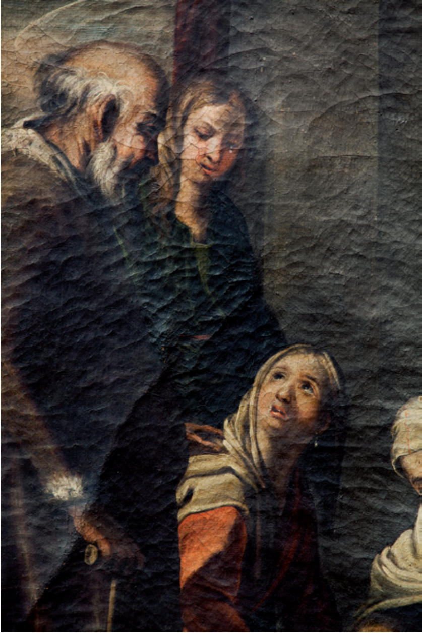
Figura 18.–Detalle del Nacimiento de la Virgen , Córdoba, Iglesia del Salvador y Santo Domingo de Silos.