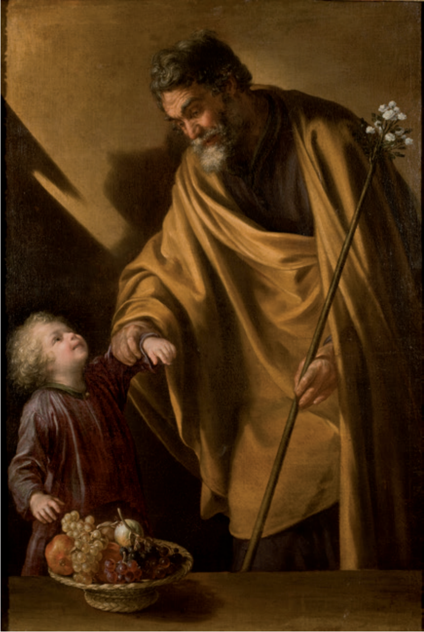
Figura 15.–Sebastián Martínez Domedel, San José con el Niño, 142 x 96 cm, ca. 1660-1665, Madrid, Museo Nacional del Prado. Nº catálogo: P008027.