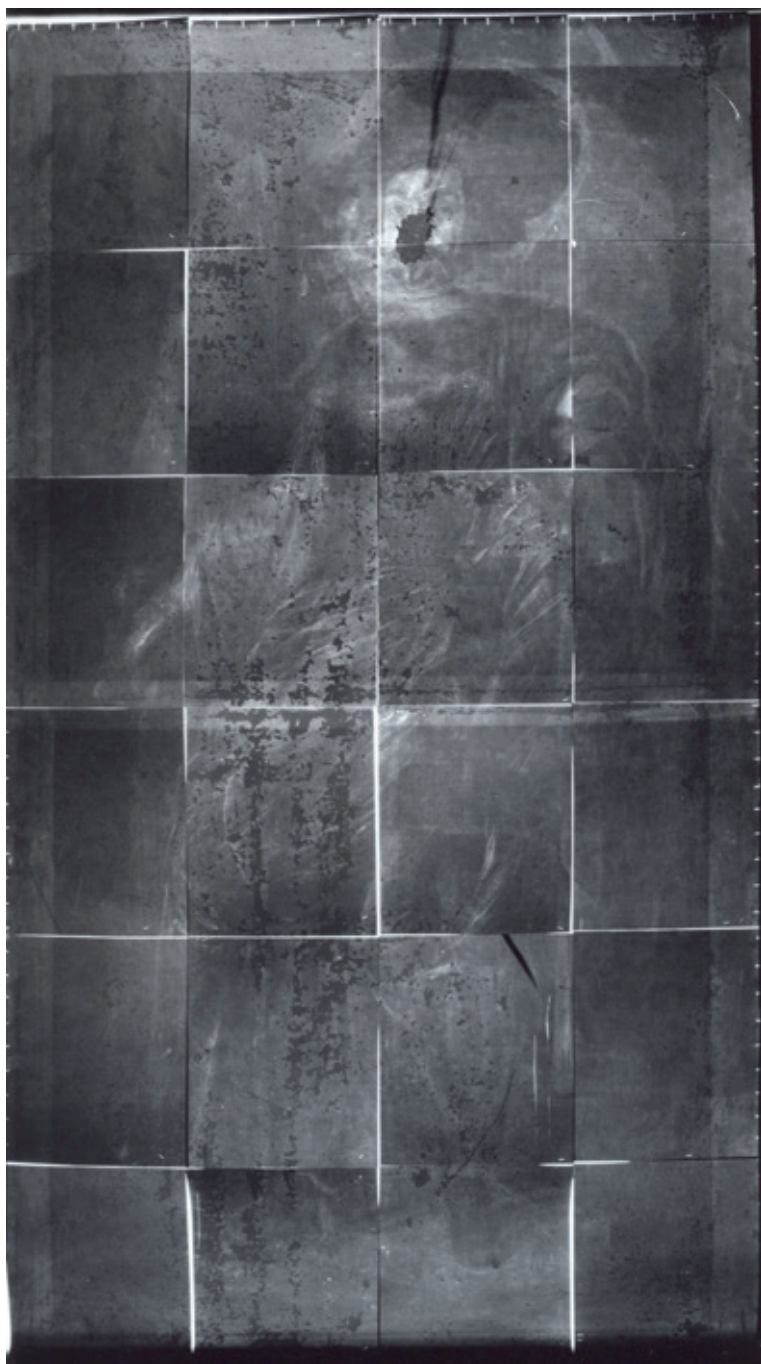
Figura 16.—Radiografía de la Santa Catalina conservada en el Museo de Jaén.