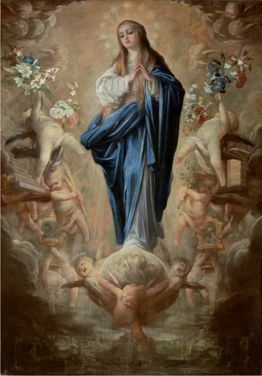
Figura 20.–Sebastián Martínez, Inmaculada Concepción , Madrid, Caylus Anticuarios.