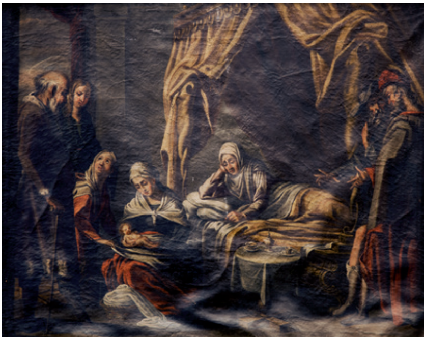
Figura 17.-Seguidor de Sebastián Martínez Domedel, Nacimiento de la Virgen , Córdoba, Iglesia del Salvador y Santo Domingo de Silos.