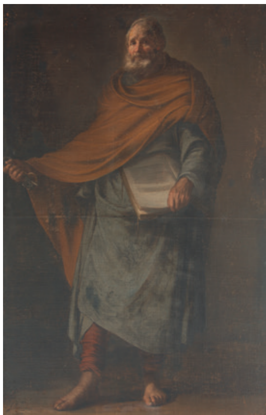
Figura 23.–Sebastián Martínez, comparación de la cabeza de San Pedro del Apostolado de Córdoba con la sexta del dibujo del Museo Nacional del Prado.