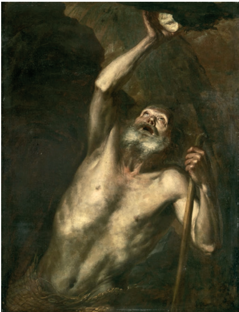
Figura 10.—Sebastián Martínez, San Pablo ermitaño , 120 x 93 cm, ca. 1655.