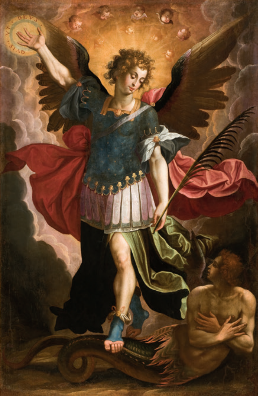
Figura 10.–Cristóbal Vela, San Miguel Arcángel , Córdoba, Museo de Bellas Artes. Nº de inventario: CE2307P.