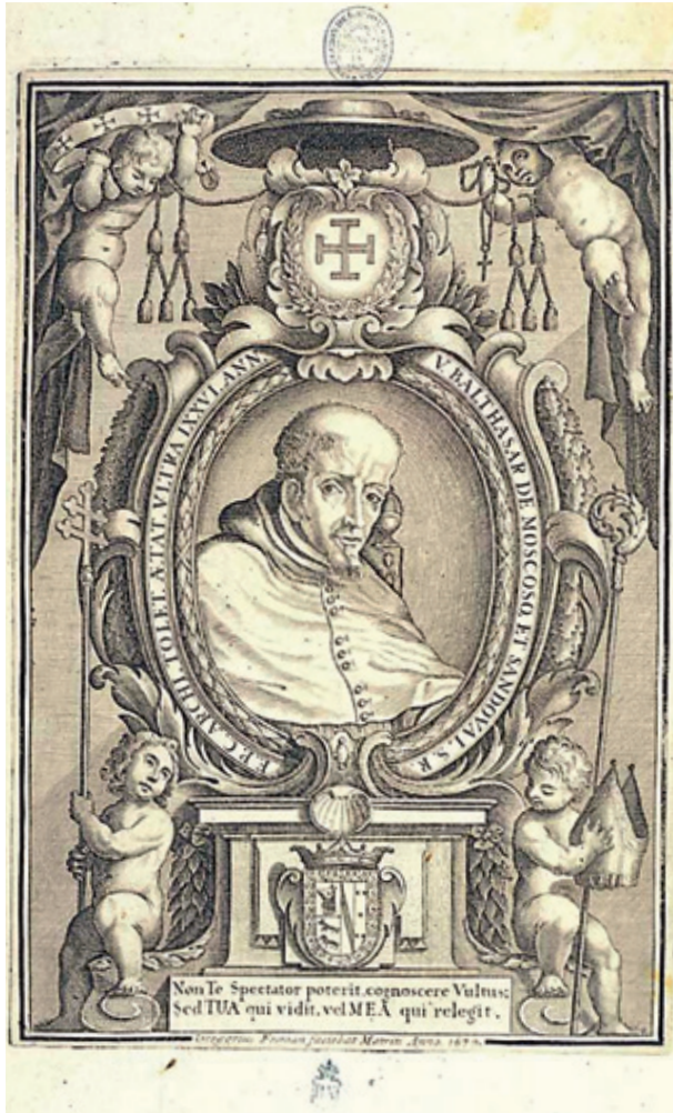
Figura 7.—Gregorio Fosman y Medina, Retrato de Baltasar de Moscoso y Sandoval , 1679.