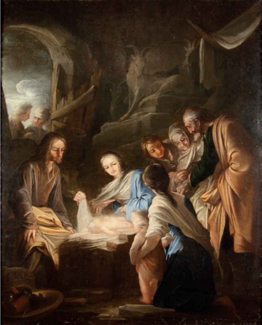
Figura 17.-Sebastián Martínez, Adoración de los pastores , Córdoba, Monasterio del Corpus Christi.