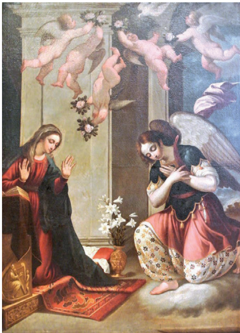
Figura 7.-Angelo Nardi, Anunciación , Jaén, Monasterio de la Concepción Francisca (Bernardas).