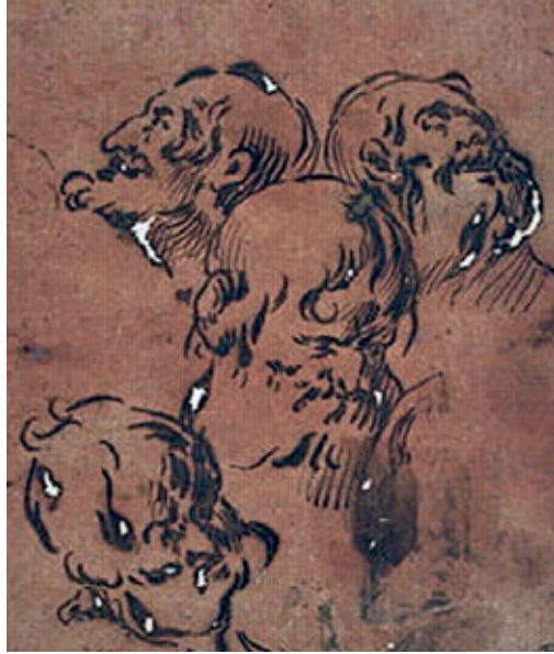
Figura 8.–Antonio del Castillo (atribuido), Cuatro cabezas de ancianos , París, Museo del Louvre. N° de inventario: RF 34431.