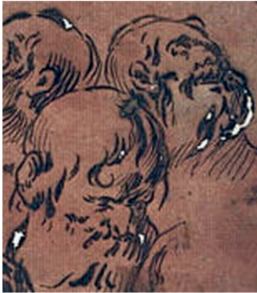
Figura 9.–Antonio del Castillo (atribuido), Cuatro cabezas de ancianos (detalle), París. © Museo del Louvre.