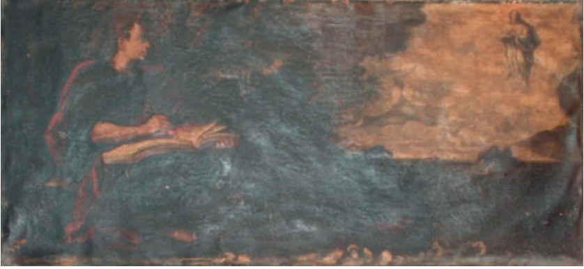
Figura 9.–Cristóbal Vela, Visión de San Juan en Patmos , Priego de Córdoba (Córdoba), Iglesia de la Asunción.