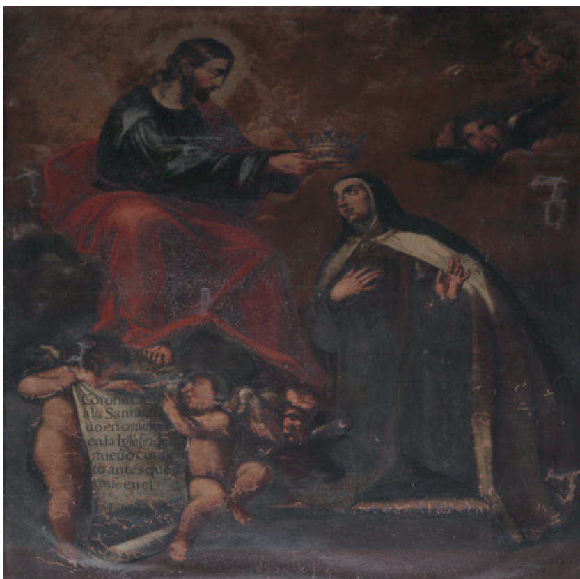
Figura 12.–Luis Bonifaz, Coronación de Santa Teresa , Granada, Iglesia del Monasterio de San José.