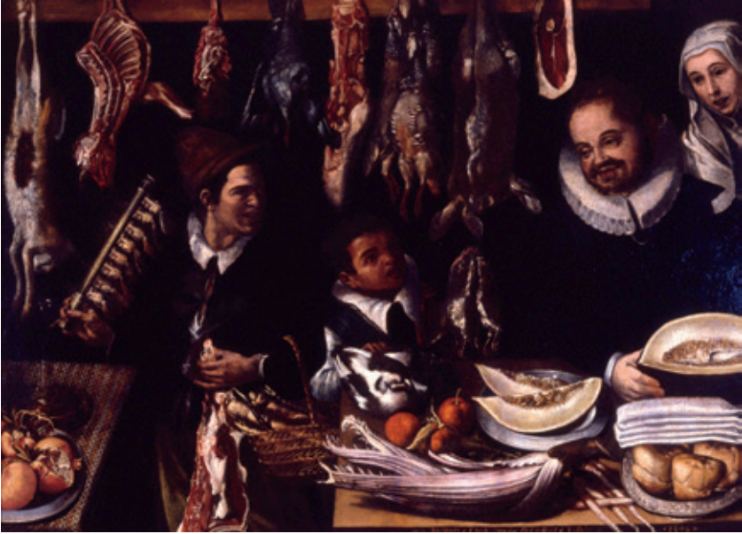
Figura 5.–Juan de Esteban de Medina, Escena de mercado , 1606. Museo de Bellas Artes de Granada. Nº de inventario: CE0126. Colección Estable.