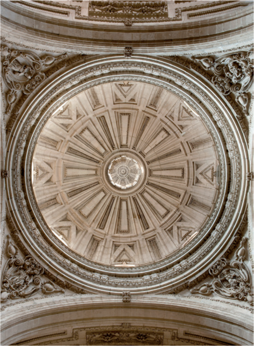
Figura 8.—Cúpula de la Catedral de Jaén.