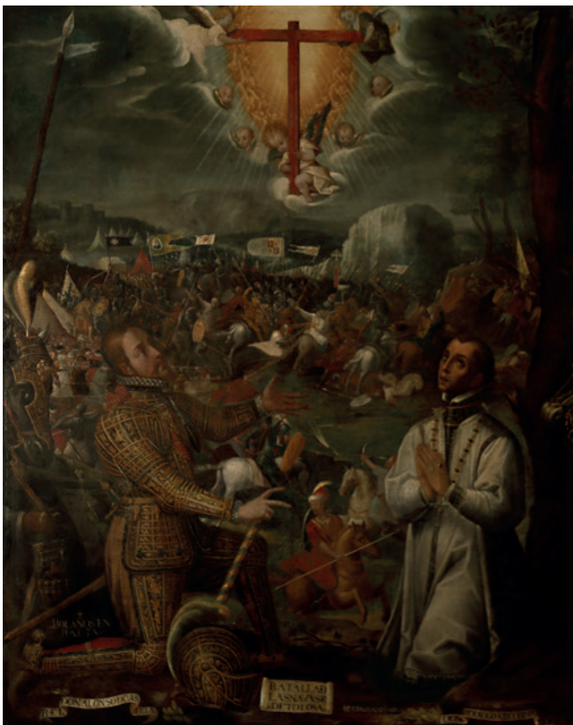
Figura 3.—Juan de Balaños, Batalla de las Navas de Tolosa , Baeza (Jaén), Museo.