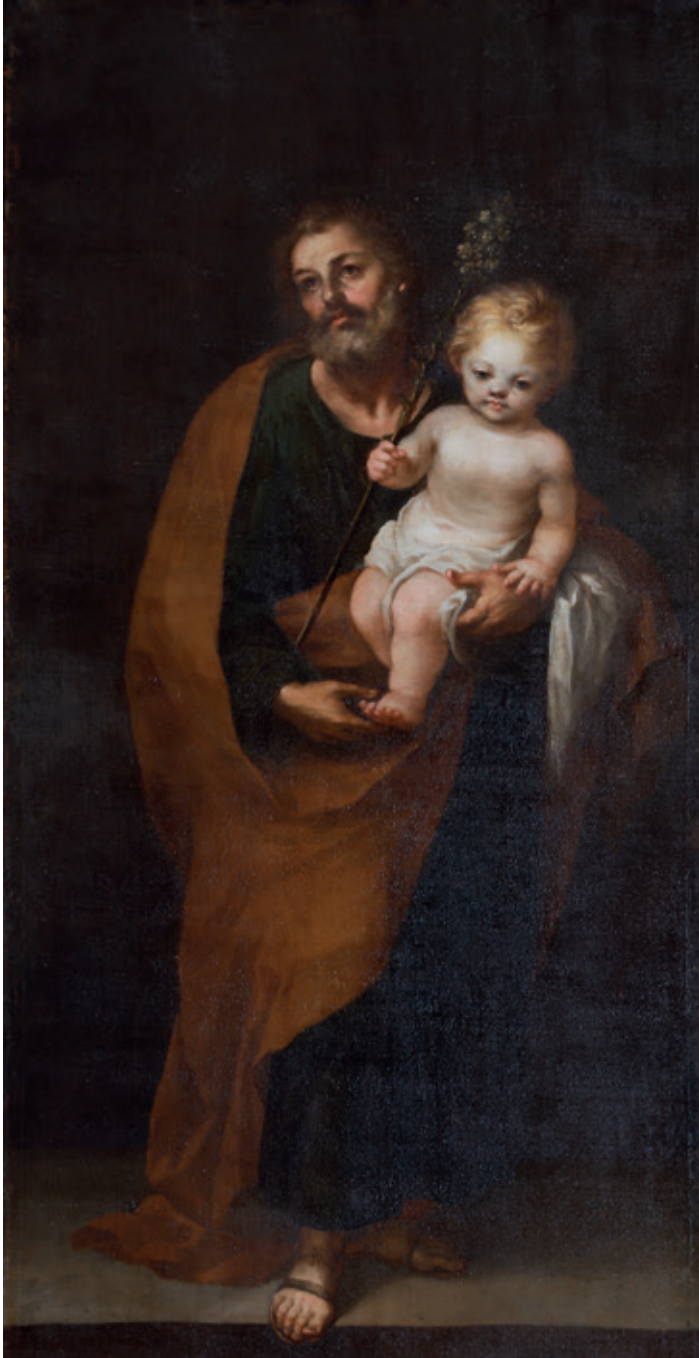
Figura 14.-Sebastián Martínez, San José con el Niño , Córdoba, Iglesia de San Nicolás de la Villa.