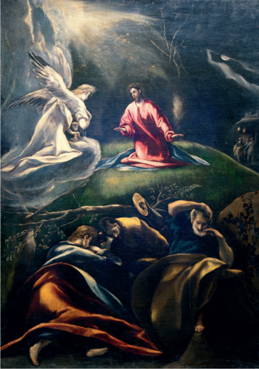
Figura 4.–El Greco, Oración en el Huerto , ca. 1600, Andújar (Jaén), Iglesia de Santa María.