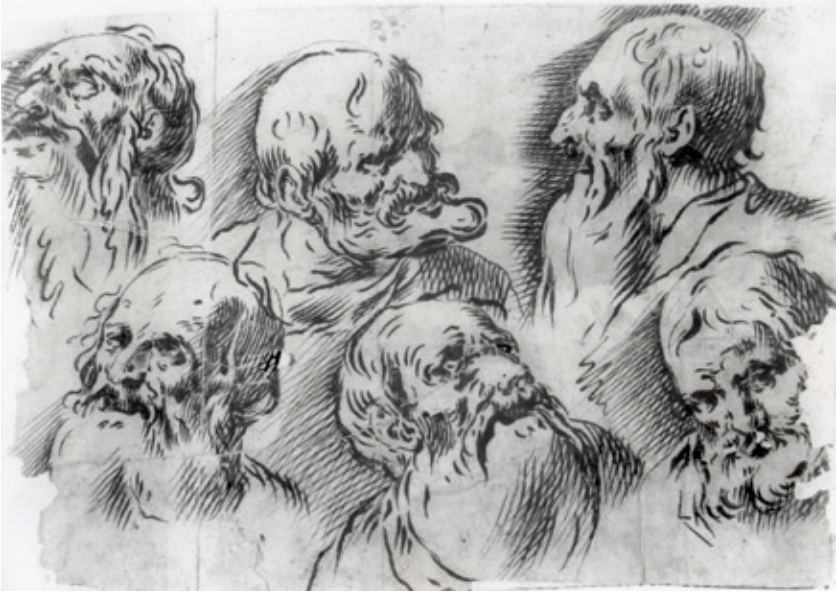
Figura 21.–Antonio del Castillo (atribuido), Seis cabezas de ancianos , Madrid, Museo Nacional del Prado. N° catálogo: D000107.