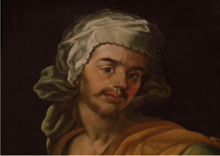
Figura 2.–Cristóbal Vela Cobo, posible retrato de Antonio Vela como Zacarías , Córdoba, Iglesia de San Agustín.