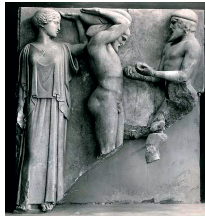
Atlas entrega a Hércules las manzanas del Jardín de las Hespérides en presencia de Atenea

Hacia 450 a. C., Mirón debió de instalarse en Atenas y empezó a recibir numerosos encargos de la ciudad y de las metrópolis jónicas sometidas a su dominio. De ese período data el encargo que realizó para el templo de Hera en Samos, un grupo colosal en bronce que representaba la Apoteosis de Heracles, si bien su obra más conocida de esta época fue el grupo de Atenea y Marsias destinado a la Acrópolis de Atenas.