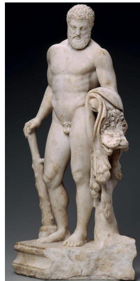
Estatua de Hércules Museum of Fine Arts, Boston, inv. 14.733.