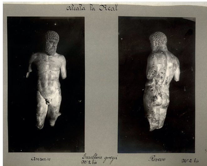
Imágenes del Hércules incluidas en el Catálogo de los Monumentos Históricos y Artísticos de la provincia de Jaén , 1915.

por el Estado con destino al Museo Arqueológico Nacional, junto con otros procedentes de otros yacimientos de Alcalá la Real que él había dado a conocer 13 .