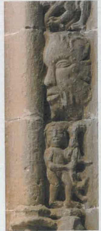
Detalle de la decoración del arco toral de la iglesia del monasterio de San Antonio

Una riqueza decorativa que daba buena prueba de la importancia del cenobio, dato que se confirma con la colección de reliquias que atesoraba, algunas de tanta valía como el Lignum Crucis , cabellos de la