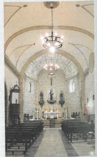
Interior de la iglesia del convento de San Antonio