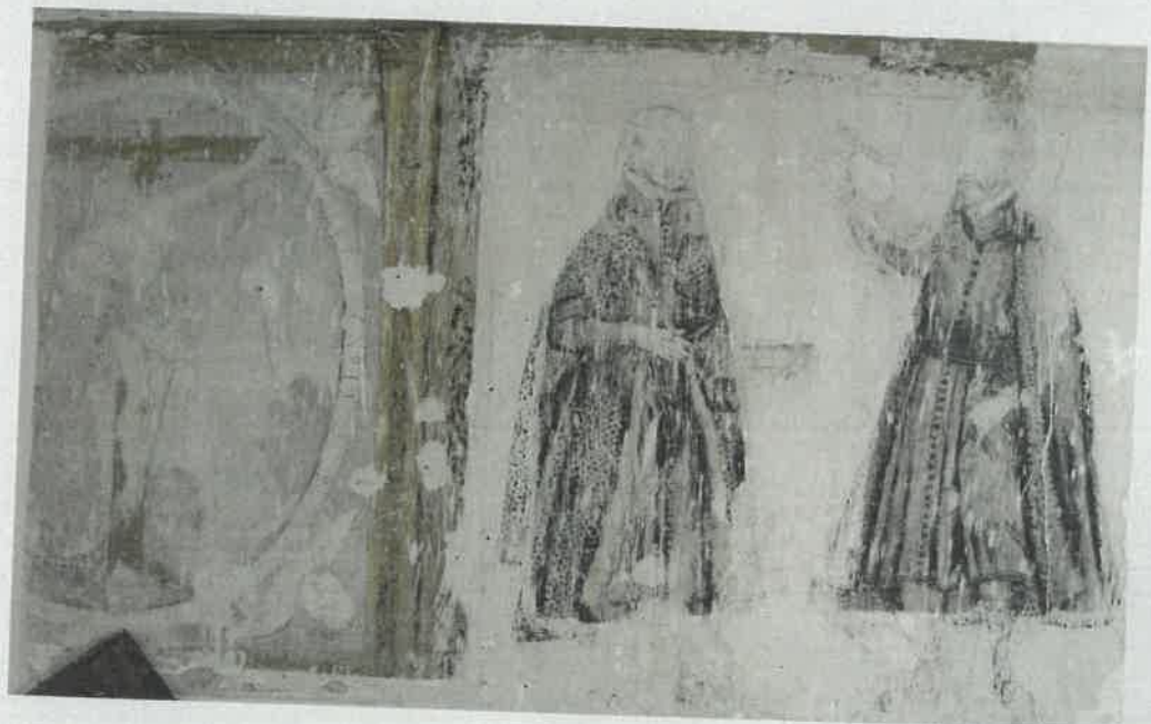
Detalle de pintura mural: El abrazo del Crucificado a San Francisco y también otros santos de diferentes órdenes como San Ignacio y San Francisco Javier. «Iglesia Vieja» dependencia del claustro del monasterio de San Antonio

San Antonio de Baeza se nos muestra como uno de los cenobios más antiguos del Reino de Jaén, con más de cinco siglos de antigüedad, que pese a los envites que ha sufrido, todavía se mantiene vivo y dando buenas pruebas de su glorioso pasado.