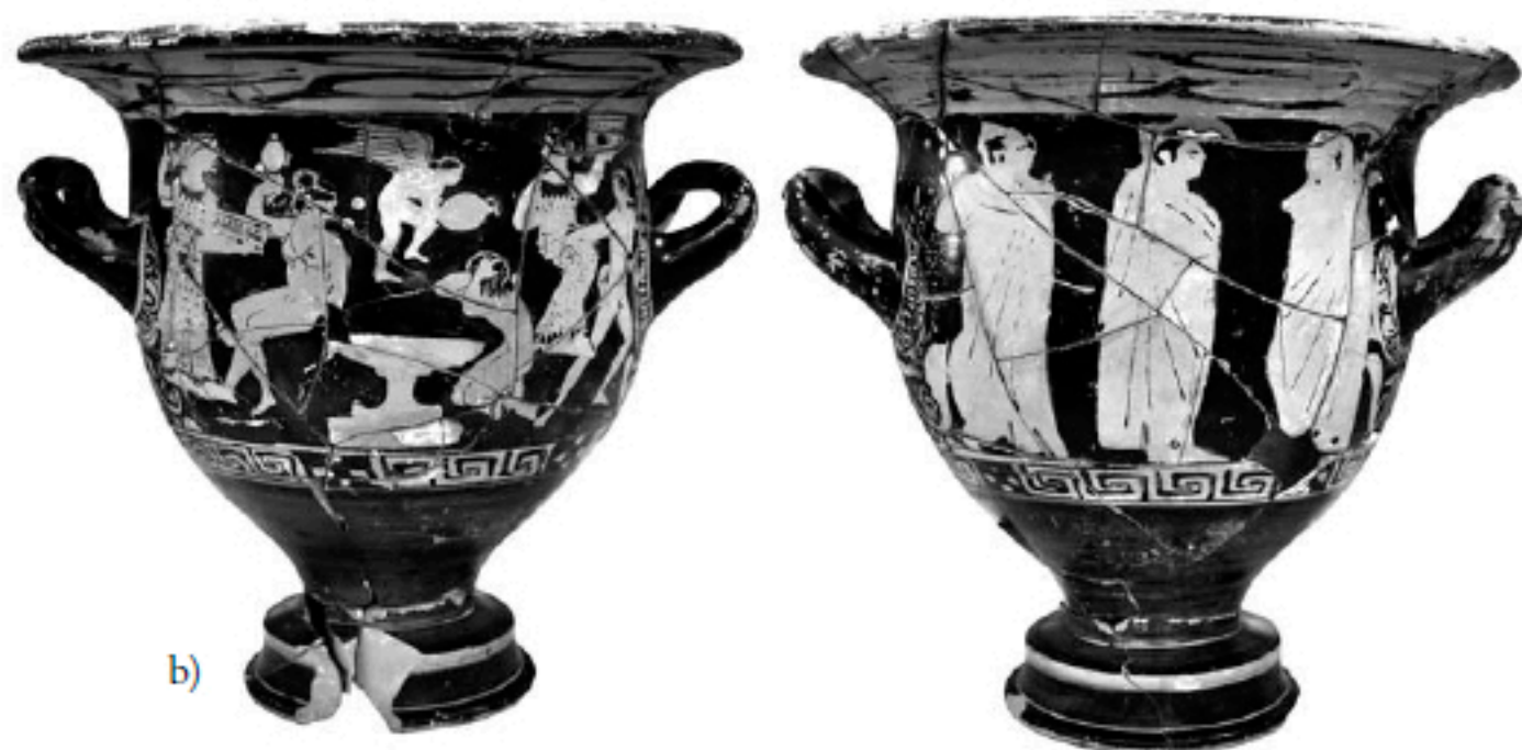
a) Cratera n 4; b) cratera n. 5