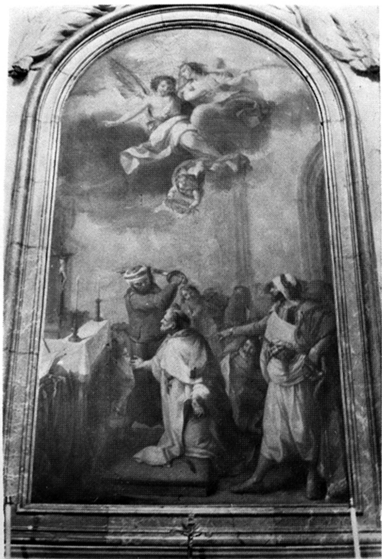
Z. GONZALEZ DE VELAZQUEZ. Martirio de San Pedro Pascual. Sagrario de la Catedral. JAEN