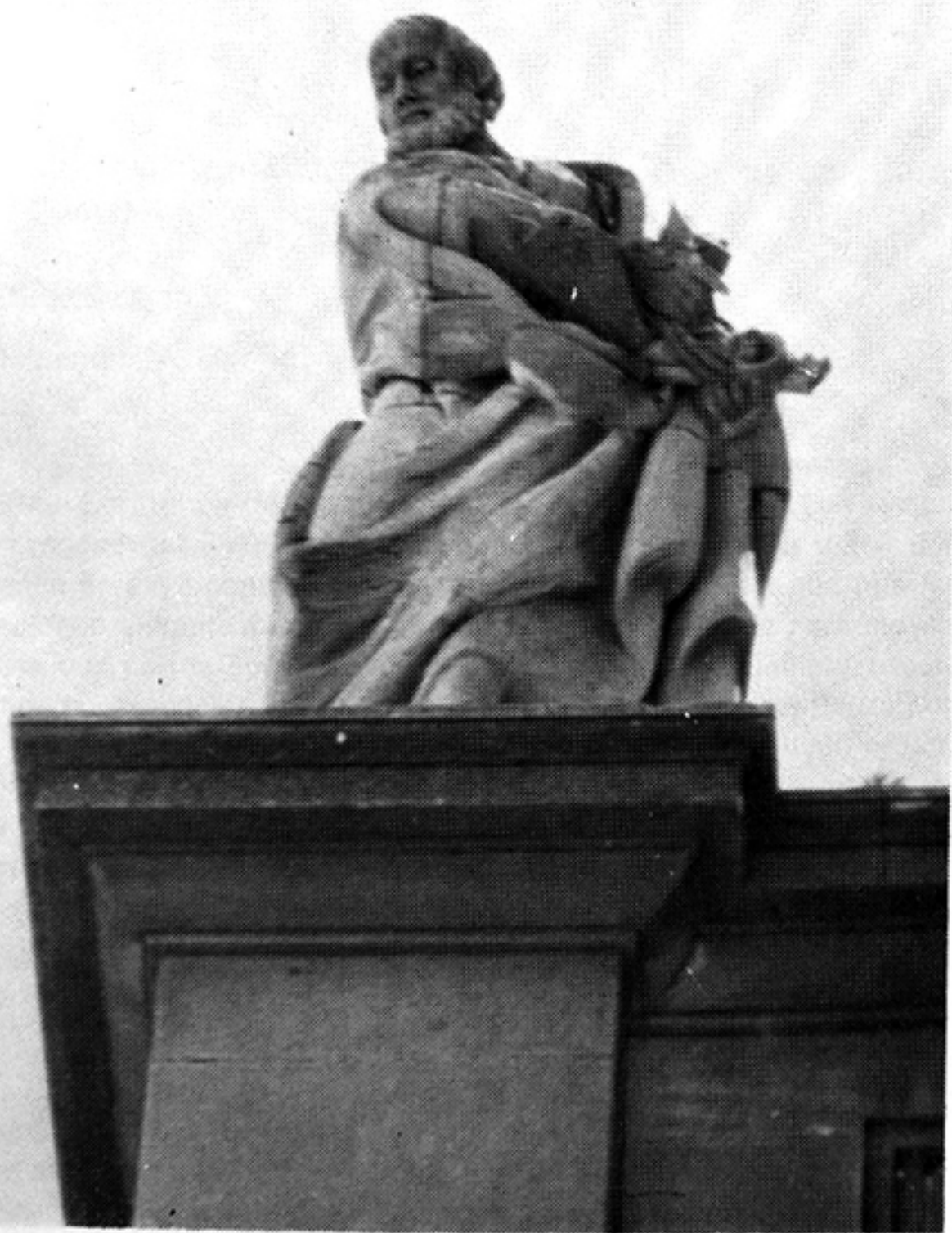
M. VERDIGUIER: San Pedro. Fachada del Sagrario de la Catedral. JAEN