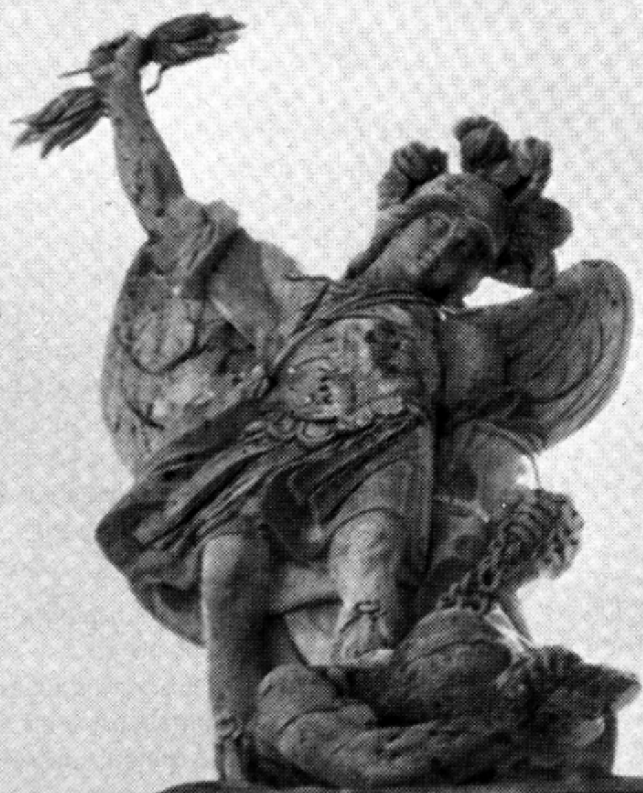
M. VERDIGUIER: San Miguel. Fachada del Sagrario de la Catedral. JAEN