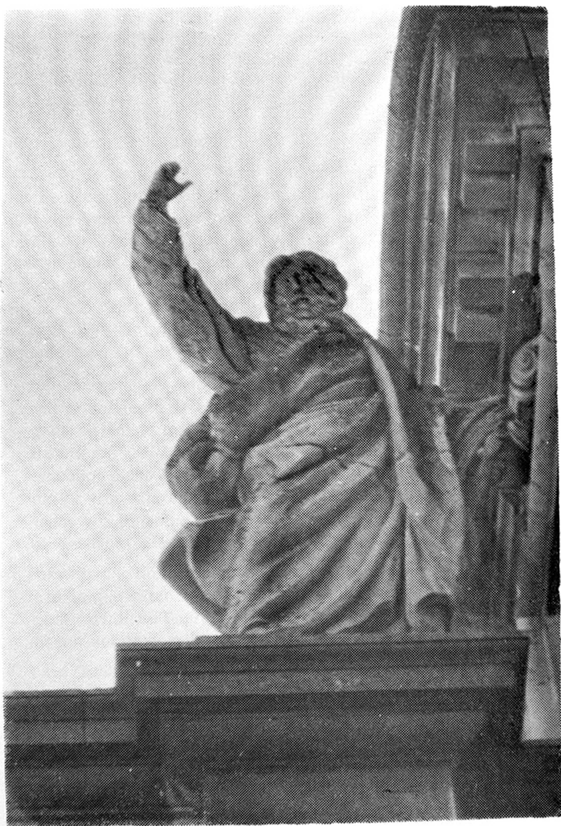
M. VERDIGUIER: San Pablo. Fachada del Sagrario de la Catedral. JAEN