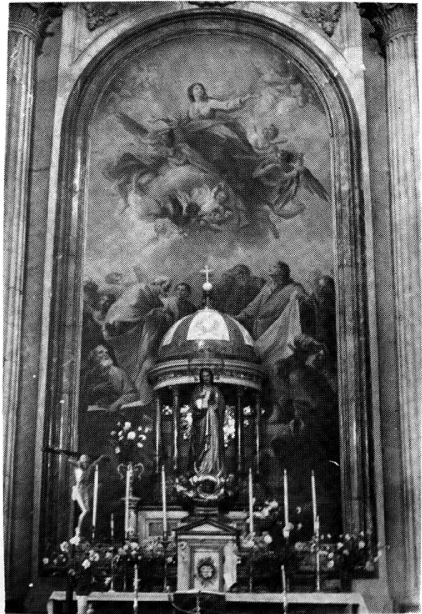
MARIANO SALVADOR MAELLA: La Asunción de la Virgen. Sagrario de la Catedral. JAEN