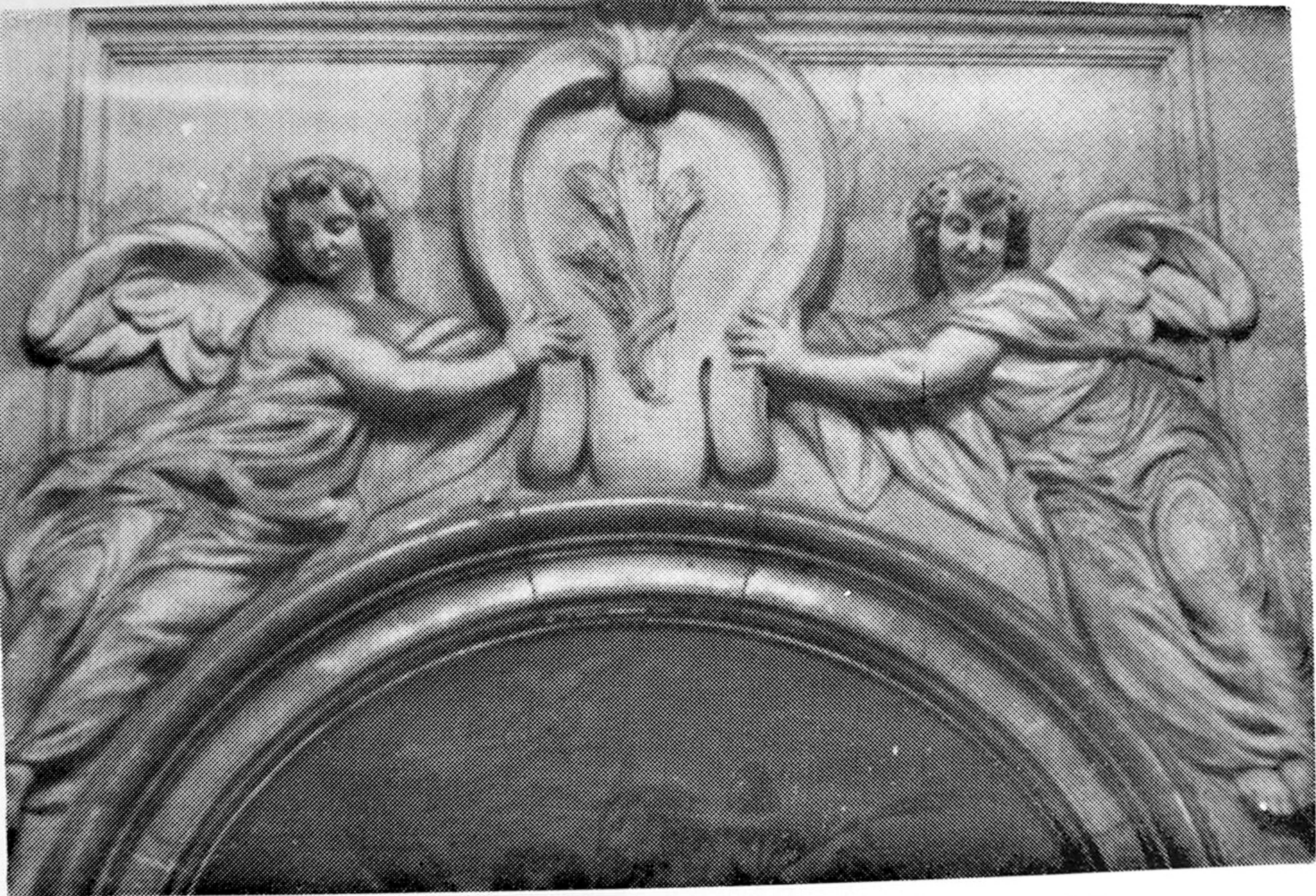
MIGUEL VERDIGUIER: Angeles. Altares laterales del Sagrario de la Catedral. JAEN