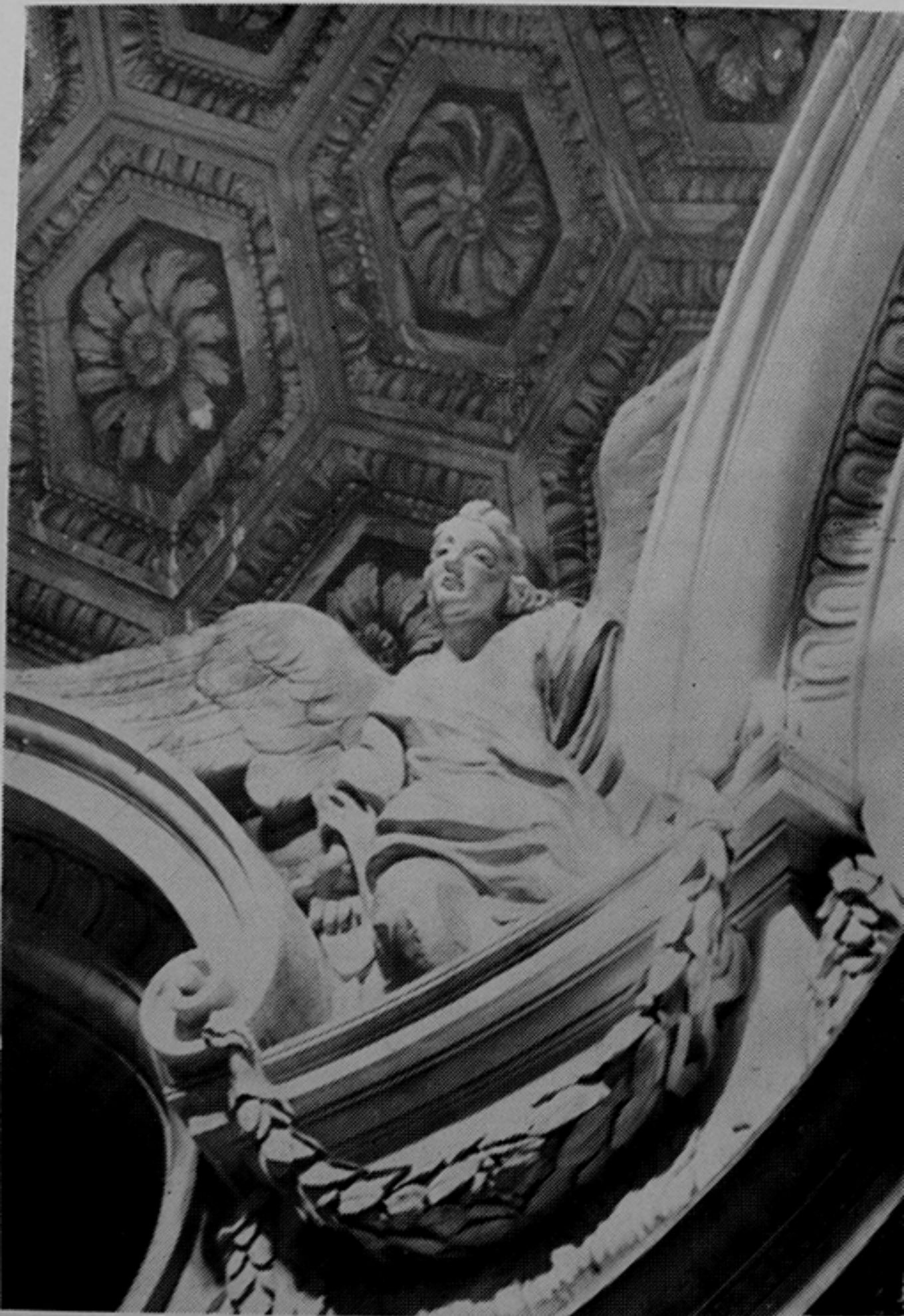
M. VERDIGUIER, según modelos de JOSE ARIAS: Angel adorador. Bóveda del Sagrario de la Catedral. JAEN