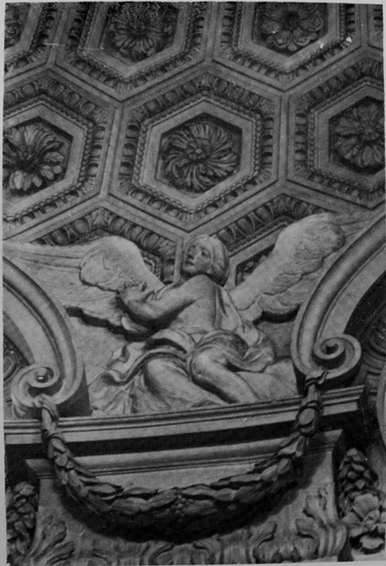
M. VERDIGUIER, según modelos de JOSE ARIAS: Angel adorador. Bóveda del Sagrario de la Catedral. JAEN