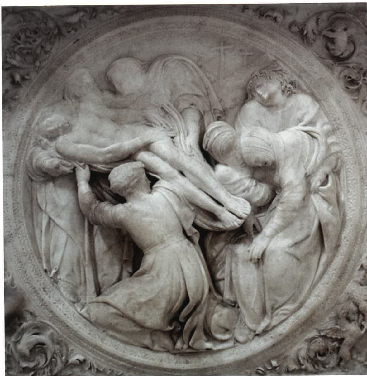
Derecha: Traslado del cuerpo muerto de Cristo al sepulcro (capilla Real de Granada).

Reyes Magos, presente ya en versiones de Giotto, Gentile da Fabriano y Botticelli. Menos convencional resulta la representación de la Sagrada Familia, con la Virgen de pie sosteniendo a Jesús, como en la capilla Caracciolo, y San José asumiendo un protagonismo inusual, tanto por su axialidad como por su implicación afectiva en la escena.