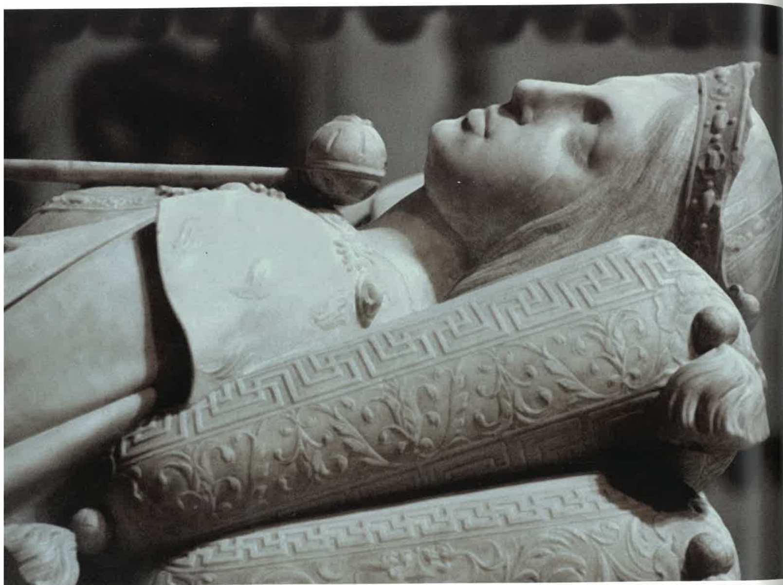
Superior: detalle de la cabeza de Juana la Loca, (capilla Real de Granada).