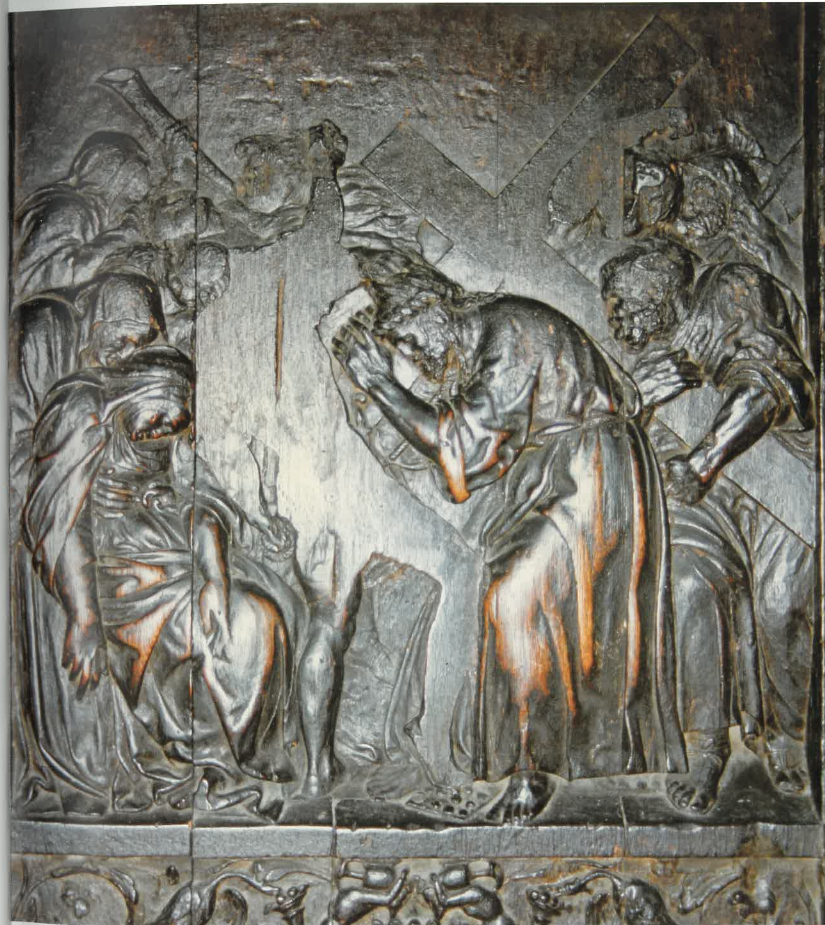
Derecha: Cristo Camino del Calvario , representado en el coro de la catedral de Barcelona.

Que la compra de mármol para el trascoro en diciembre de 1517 se hiciera en Nápoles y no en Génova, como hubiera sido lo lógico, hay que relacionarlo con los compromisos escultóricos napolitanos de Ordóñez. Quedan allí obras que se le atribuyen, entre las que merece consideración el espléndido San Mateo en