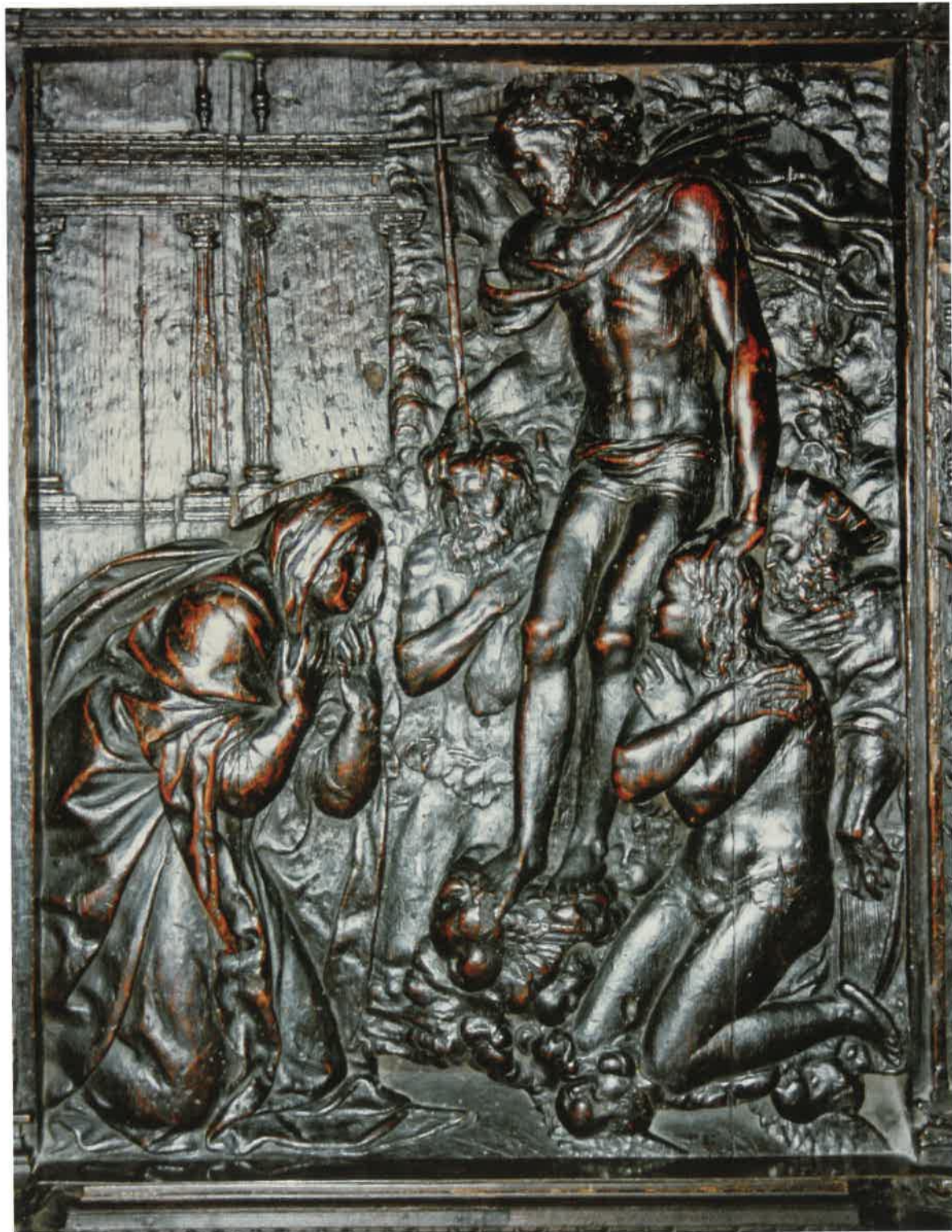
Izquierda: Aparición de Cristo resucitado a la Virgen, acompañado por los justos, representado en el coro de la catedral de Barcelona.

San Pietro Martire que le adjudicara Bologna, obra de muy elevada calidad, introspectiva composición y una magistral contención expresiva. Se reconoce el estilo de Ordóñez en la magnífica cabeza y quizá en el canon alargado de la figura; no así en el drapeado, excesivamente dramático, sin las características circunvoluciones de pliegues que redefinen las siluetas de sus imágenes. Ya en Barcelona, la Crucifixión en madera del Museo Marès (Barcelona), que también se le atribuye, refleja más el influjo de su estilo que su propia autoría.