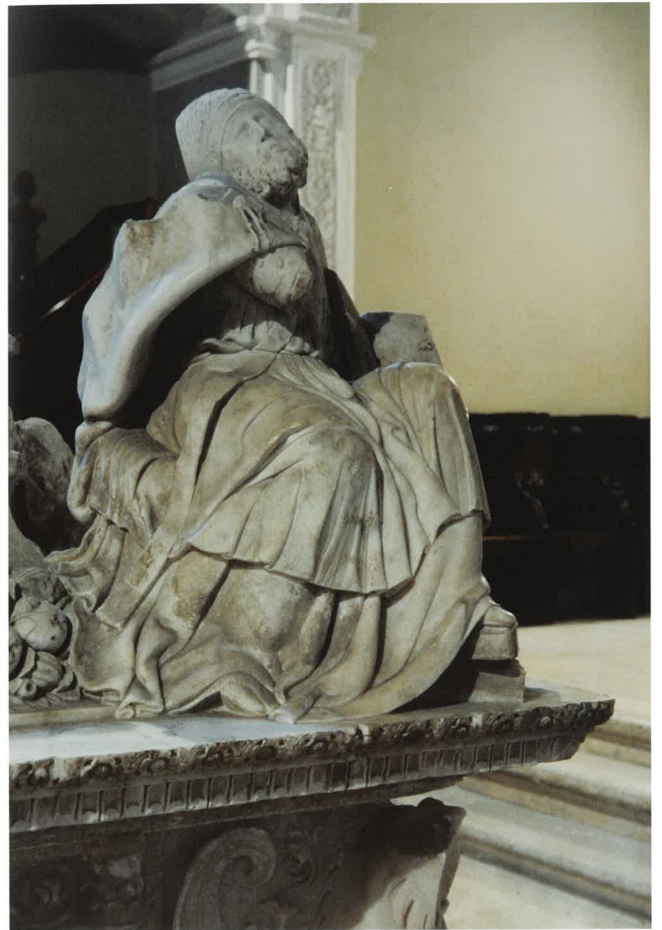
Derecha: San Ambrosio , sobre la cornisa de la cama sepulcral del sepulcro del Cardenal Cisneros en la capilla de la Universidad de Alcalá de Henares, Madrid.