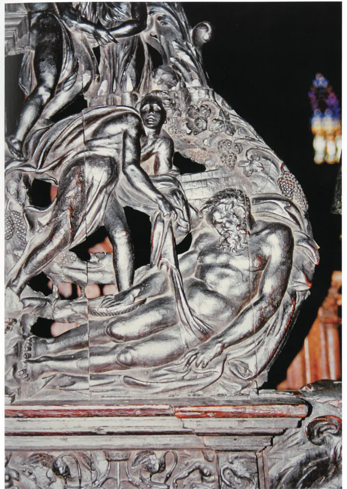
Derecha: Embriaguez de Noé, representado en el coro de la catedral de Barcelona.