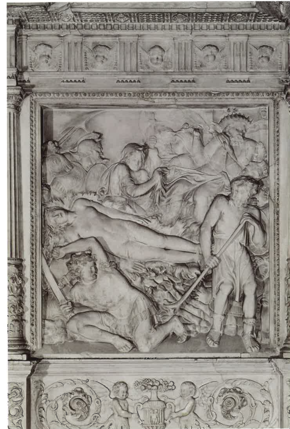
Superior: Martirio de Santa Eulalia , situado en el trascoro de la catedral de Barcelona.