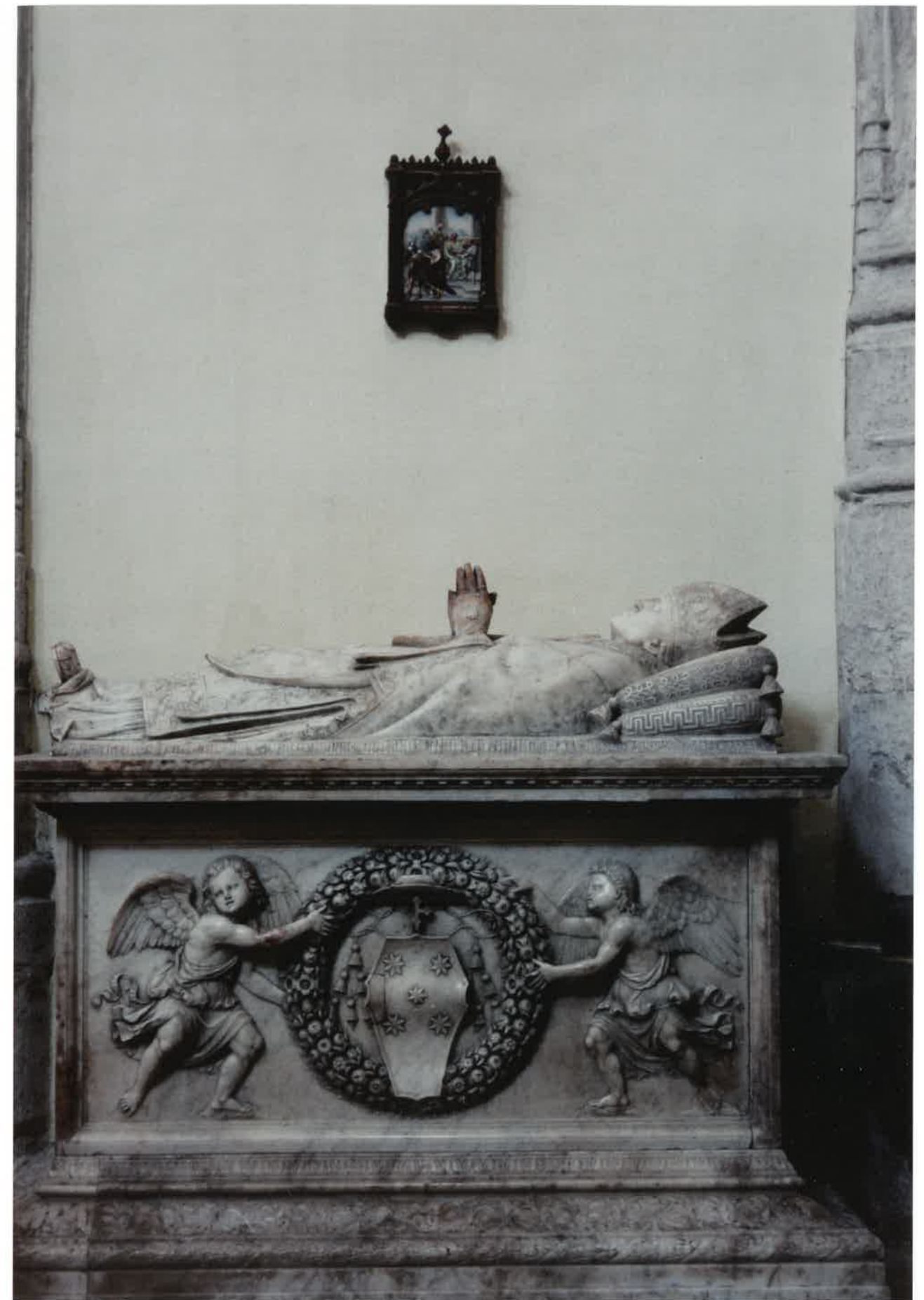
Derecha: sepulcro del Arzobispo Alonso de Fonseca, en la iglesia de Santa María (Coca, Segovia).