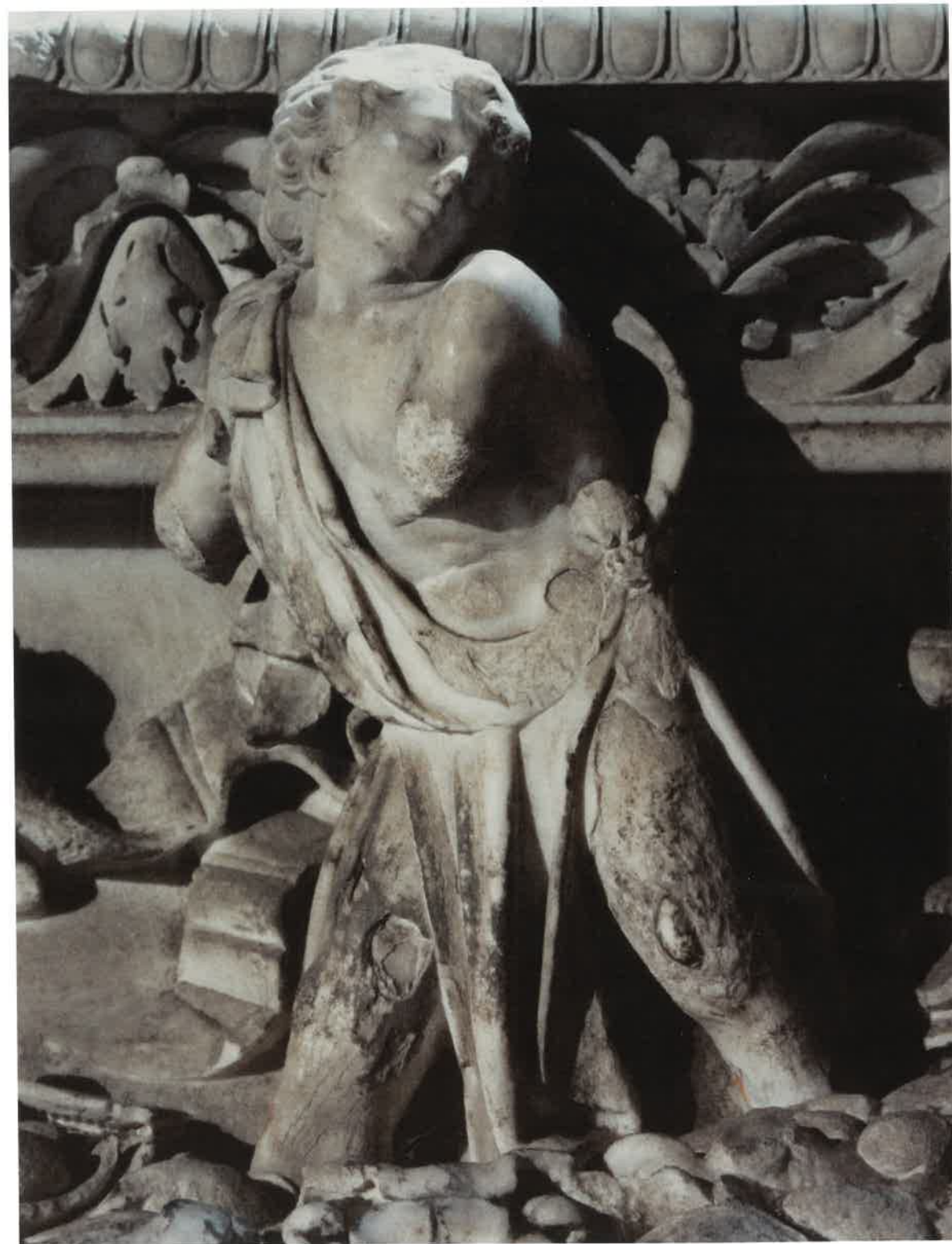
Izquierda: Adán , representado en el friso del sepulcro del Cardenal Cisneros en la capilla de la Universidad de Alcalá de Henares, Madrid.

En el friso y en altorrelieve, enmarcados por festones de guirnalda sostenidos por ángeles, Adán dedicado a las labores de la tierra, según una composición que reproduce la figura del hijo de Noé que cubre la desnudez de su padre en el relieve de la sillería de coro de la catedral de Barcelona; y una Eva desnuda, sentada entre sus hijos, cuyo esquema deriva también de la Capilla Sixtina. En la cabecera y pies, dos niños sostienen los blasones del prelado y el epitafio, cuya redacción se atribuye al célebre humanista toledano Juan de Vergara.