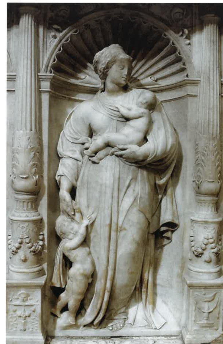
Izquierda: la Caridad (capilla Real de Granada).

De superior calidad son las de la cabecera del sepulcro— Aritmética y Filosofía — y en el lateral derecho, la Fortaleza y la Caridad . La primera está representada con la apariencia de un hombre barbado con la cabeza velada—Pitágoras o Nicómaco, sus más ilustres representantes, que se asocian a la iconografía de la Aritmética, llegando incluso a sustituirla—, aleccionando a un atento escolar mediante el cómputo digital, según una larga tradición iconográfica que hay que remontar a Marciano Capella y Alain de Lille, generalizándose en la plástica italiana y francesa de los siglos XIII y XIV. La Filosofía aparece efigiada como una matrona anciana, como la imaginó Boecio, de concentrada y severa expresión, mostrando las manos cuidadosamente engarzadas, lo que refuerza su actitud contemplativa, figurando a sus pies dos libros. Este énfasis en la reflexión y en