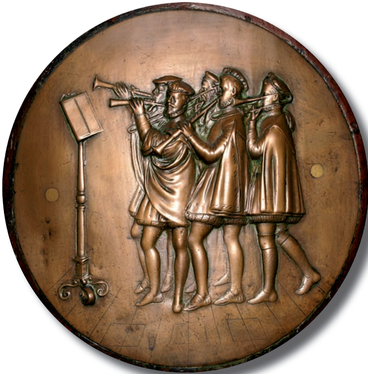
Ministriles en un medallón del facistol de la Catedral de Sevilla.