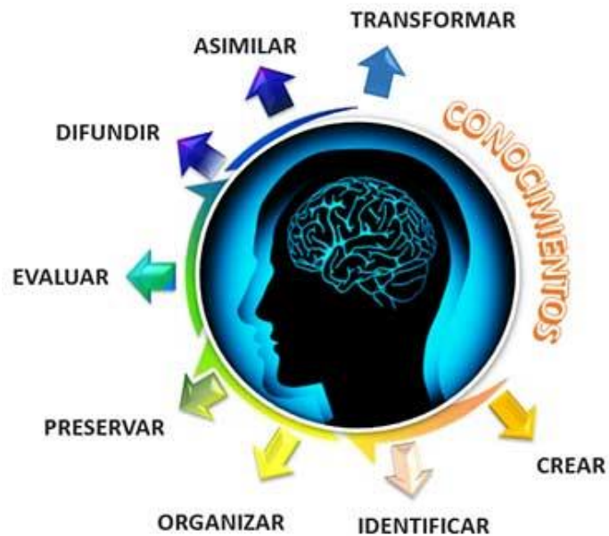
FIGURA 2 Sociedad del Conocimiento

(Forero, 2009) cuando menciona a la Fundación de la Sociedad del Conocimiento