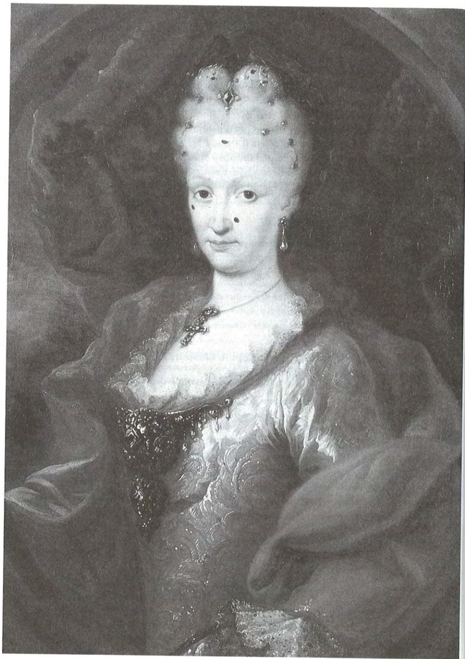
Fig. 1 - MIGUEL JACINTO MELÉNDEZ, Elisabetta Farnese . 1718 ca., Madrid, Casa de la Moneda.