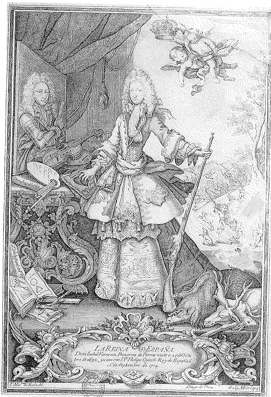
Fig. 5 - MATIAS DE IRALA Y DIEGO DE COSA, Isabel de Farnesio . 1715. Biblioteca Nacional de Madrid.