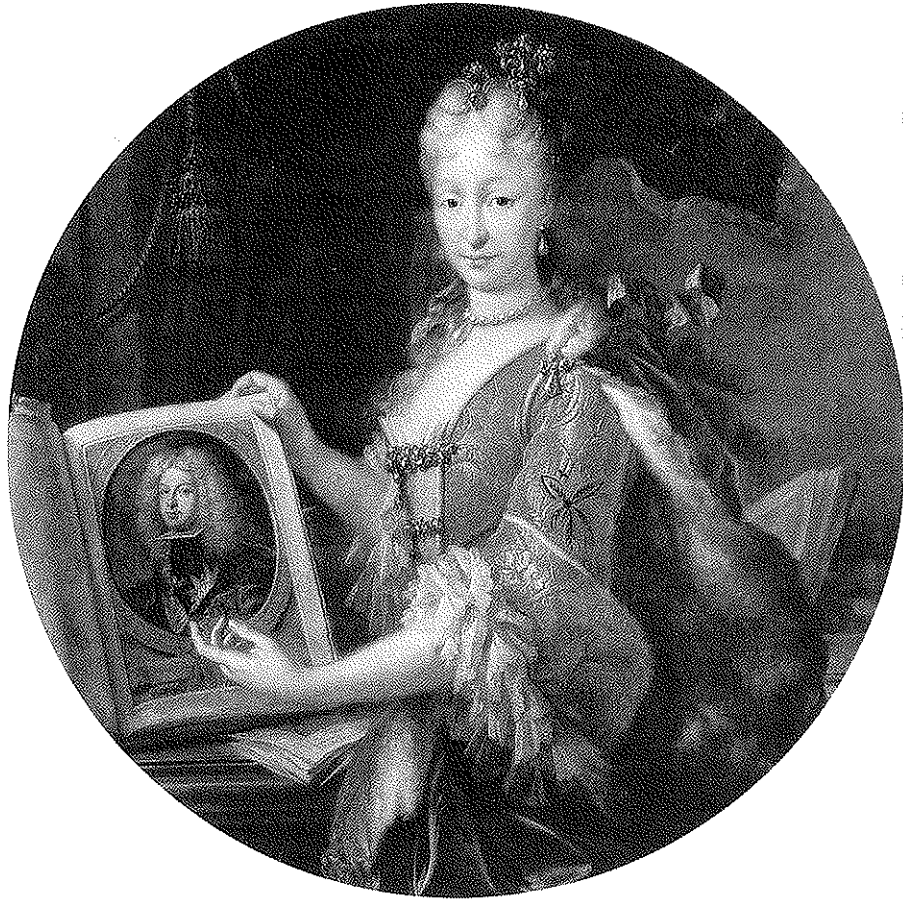
Fig. 3 - MIGUEL JACINTO MELÉNDEZ, Elisabetta Farnese . 1727, Madrid, Biblioteca Nacional.