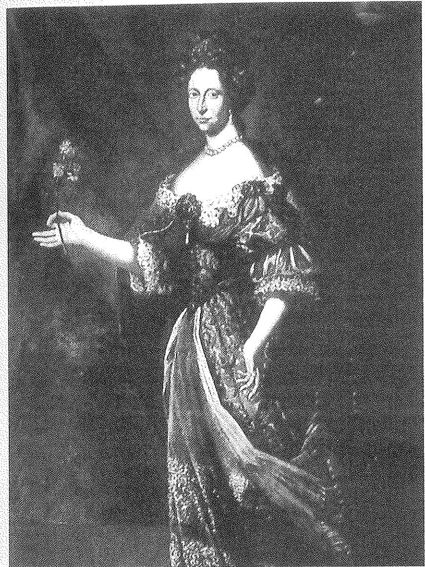
Fig. 4 - Anónimo parmense, Dorotea Sofia de Neoburgo . Fine del XVII secolo, Galleria Nazionale di Parma.