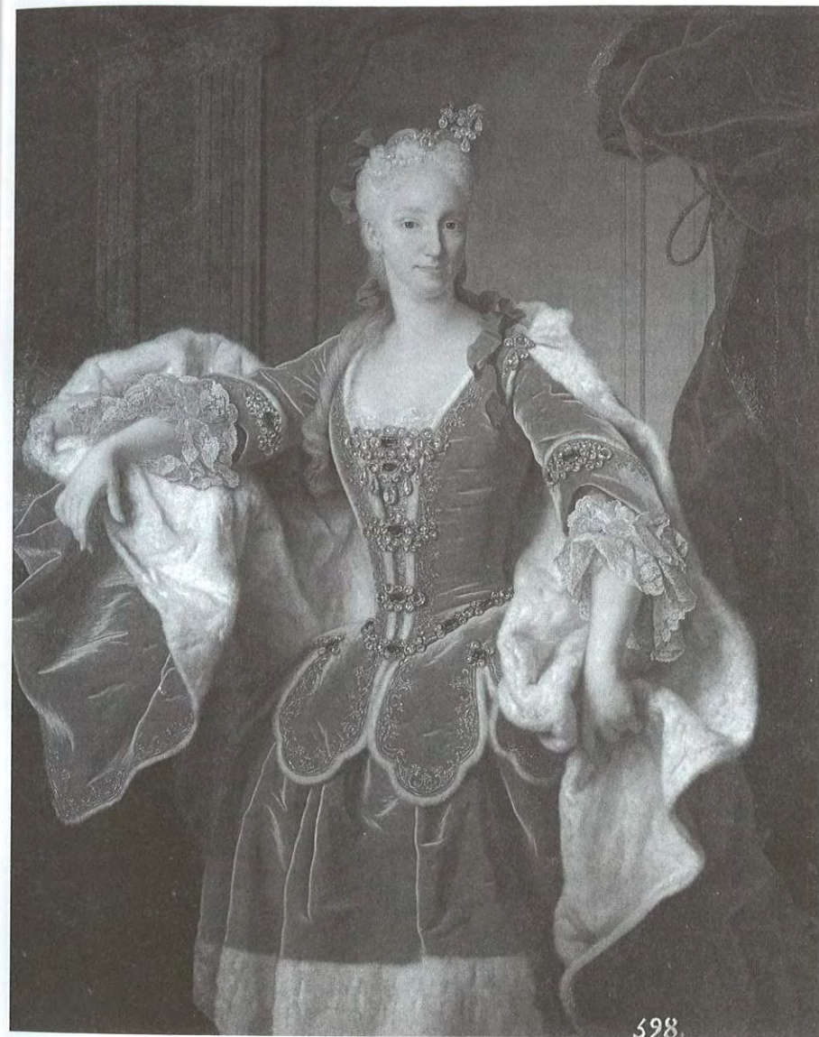
Fig. 2 - JEAN RANC, Elisabetta Farnese . 1723, Madrid, Museo Nacional del Prado.