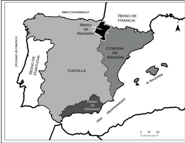
MAPA I. Navarra y su contexto geopolítico (siglos XIII y XIV)