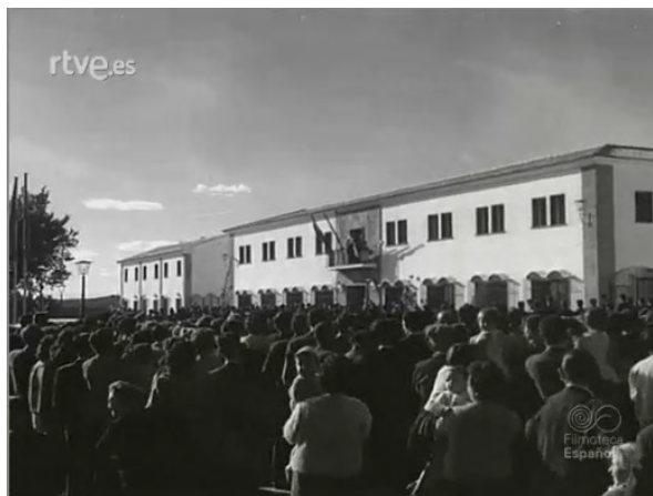
Imagen 5. Inauguración de una granja-escuela en Marmolejo (Jaén) (1958). Noticiario 956B http://www.rtve.es/filmoteca/no-do/not-956/1470430/