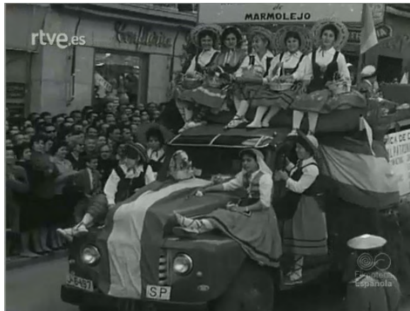
Imagen 4. Mujeres “adornan” las carrozas del desfile del Plan Jaén (1958).