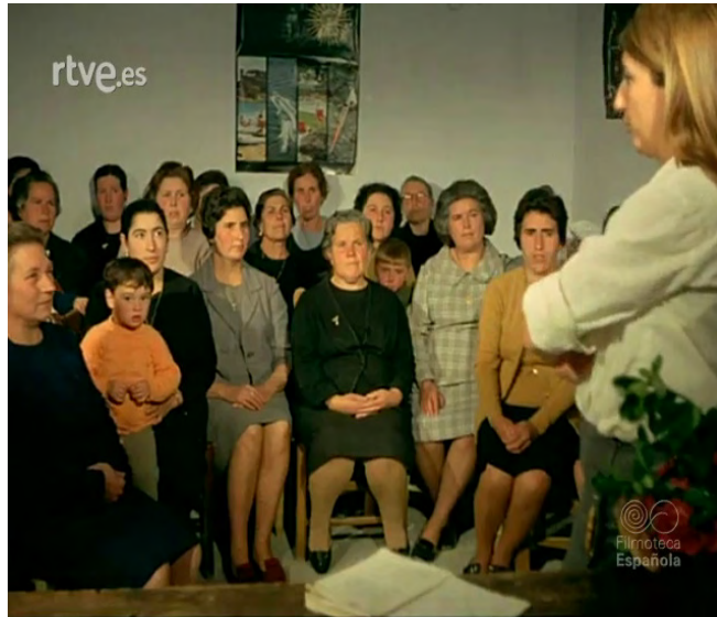
Imagen 7. Una instructora de la Sección Femenina instruye a las vecinas de Cárcel (Jaén) sobre el parto y puerperio (1970). https://www.youtube.com/watch?v=qn0DzieusWs (1970). Enseñanza y alegría de la Sección Femenina (1960).

como “regeneración social” de la ciudadanía de enclaves geográficos-pueblos y aldeas de menos de 5000 habitantes-deprimidos y con variadas carencias. El adoctrinamiento político era clave en esta regeneración, pues consideraban que: