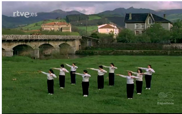
Imagen 8. Las instructoras de la Sección Femenina imparten clases de Educación Física. “Enseñanza y alegría: la Sección Femenina por las rutas de España” (1960): http://www.rtve.es/alcarta/videos/revista-imagenes/ensenanza-alegria-seccion-femenina-rutas-espana/2856036/ .

La reflexión conceptual e ideológica del patriarcado y sus pervivencias en el siglo XXI continúa orbitando en las investigaciones que tratan de dilucidar las causas del fracaso efectivo, real, cotidiano, de los avances legislativos en material de igualdad y no puede ser de otra forma en una sociedad, como la española, que continúa viviendo y padeciendo sus envites y reminiscencias, cuyas repercusiones trascienden, y de qué manera, un modo de ser, estar y entender la vida de las mujeres de este país y no sólo de las generaciones que se formaron en aquellos años (Peinado Rodríguez, 2018).