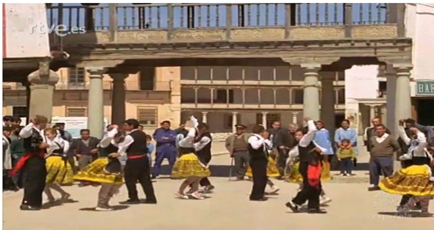
Imagen 9. Recuperación del folklore autóctono gracias a la labor de las Cátedras Ambulantes. https://www.youtube.com/watch?v=qn0DzieusWs (1970). Enseñanza y alegría de la Sección Femenina (1960).