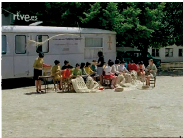
Imagen 1. Talleres de artesanía organizados por las Cátedras Ambulantes en Cárcel (Jaén) (1970).

Por otra parte, y en línea con nuestro análisis desde la perspectiva de género, exceptuando los estudios culturales, como nos muestra Rosón (2016: 7), no existe un desarrollo analítico en profundidad sobre las identidades de género y sus interrelaciones con el material visual durante el primer franquismo, porque es fundamental reflexionar en torno a las pervivencias del patriarcado en la sociedad actual, a través de las mujeres que vivieron en el franquismo y educaron en este contexto a sus hijos y, fundamentalmente, a sus hijas, abuelas y madres de las nuevas generaciones.