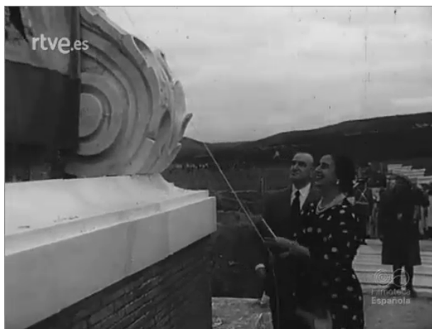
Imagen 2. Carmen Polo inaugura el Pantano de Guadalén (Jaén) (1953). Noticiero 540A ( http://www.rtve.es/filmoteca/no-do/not-540/1487603/ ).

con ese porte de mujer matrona, avejentada, portadora de vestidos y trajes sin formas, con moño bajo, sin tintes, parapetada en su papel de consorte 5 , sin más habilidades que la de participar en los actos religiosos, correr cortinillas o cortar cintas en destacadas inauguraciones, mujer de su casa, amantísima madre de familia.