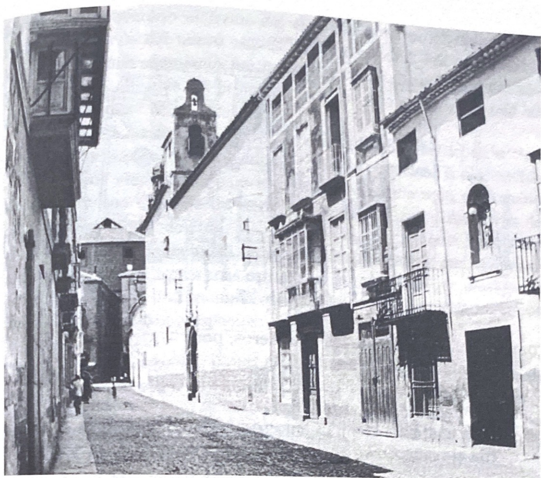
(Fig. 2) Monasterio de la Concepción Dominica en su emplazamiento de la calle Ancha, Jaén.

Ildefonso el monasterio dejaba una de las collaciones más señeras de la ciudad que, sin embargo, durante el siglo XVII comenzaría un retroceso materializado en una notable despoblación. Sin duda, el traslado evidenció una inmejorable perspectiva de futuro al situar la institución en un lugar que siempre arropó a la comunidad y que, en gran parte, garantizó su sustento (Fig. 3).