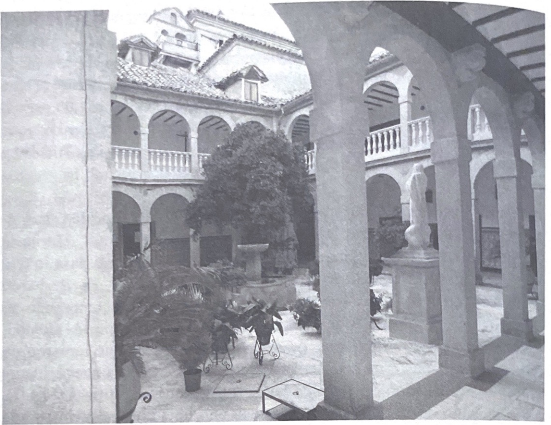
(Fig. 7) Claustro del monasterio de la Concepción, Úbeda (Jaén).

poco transitados, con viviendas pequeñas y algunos muladares, siempre en las proximidades de la muralla. En pocos años la estructuración del monasterio acabó con todos estos elementos accesorios y supuso un ennoblecimiento del enclave.