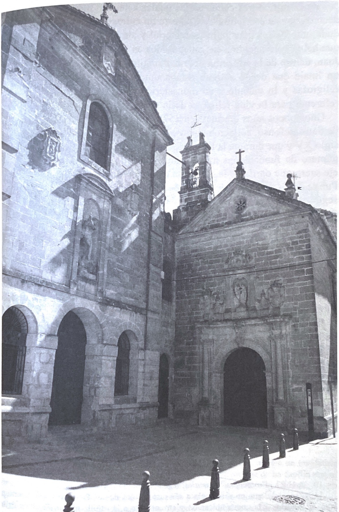
(Fig. 1) Convento de San Miguel, Úbeda (Jaén) (Foto: autor).