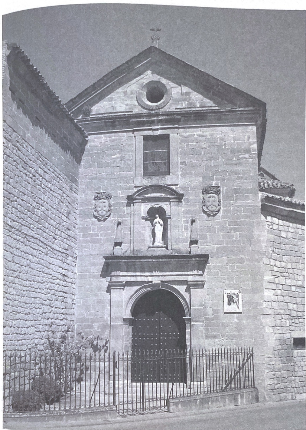
(Fig. 4) Monasterio de la Concepción, Úbeda (Jaén) (Foto: autor).