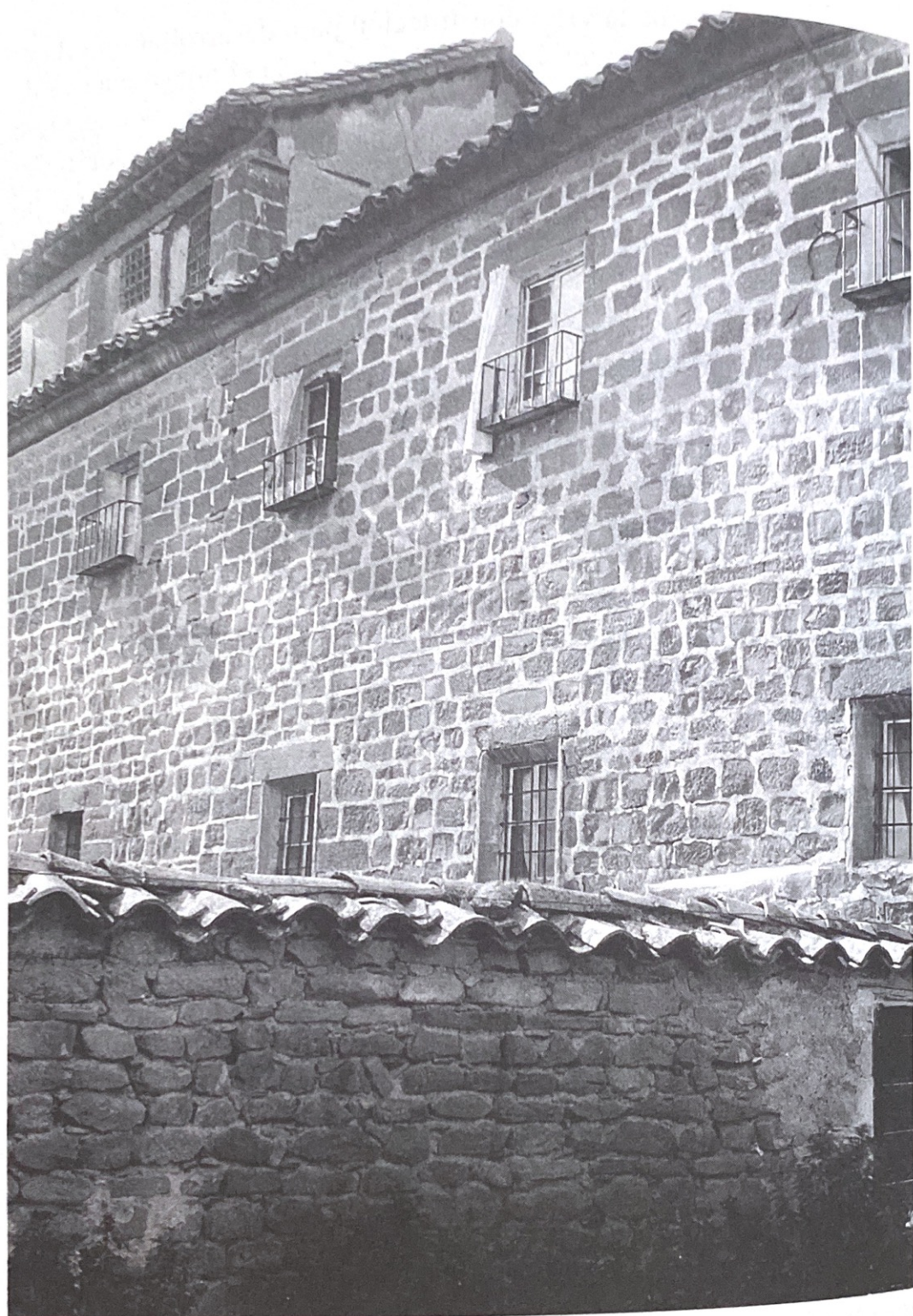
(Fig. 8) Cuerpo posterior del monasterio de la Concepción, Úbeda (Jaén).