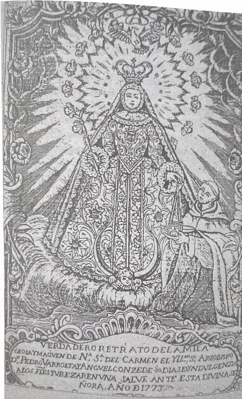
Fig. 2. Virgen del Carmen del Convento de La Coronada.