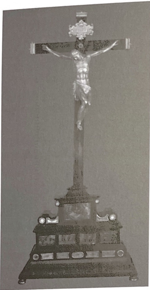
4. Crucificado-relicario. Exposición Permanente. Catedral de Jaén.

este cenobio, destacan un Calvario sobre peana-relicario y un Crucificado sobre marco-relicario en ébano, ambas imágenes de Cristo y la estructura del primero son muy cercanas a la de Jaén 33 . De igual modo, existen paralelos con la figura de Cristo en la Flagelación atribuida a Alessandro Algardi (1630-1640) de la capilla de María Santísima de la Aurora en Lucena 34 . Sus fechas coinciden con las de la realización de la pieza de Jaén. A través de los inventarios del siglo XVIII, podemos identificarlo con el Crucificado existente en el altar mayor, lo que da prueba de la valía y consideración recibidas, sin olvidar las preciadas reliquias que custodia 35 .