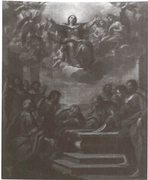
5. Asunción de la Virgen. E. GRAZIANI. Exposición Permanente. Catedral de Jaén.

Desconocemos la vía de llegada de las obras del boloñés Ercole Graziani, estudiadas por el Dr. Urrea, seguramente se trate de algunas de esas "láminas" que entraban en la catedral vía testamentaria. Graziani (1688-1765), pintor boloñés, estudió con Ludovico Mattioli y Donato Creti. Éste último lo anima a seguir los modelos de Carracci y Reni, plasmados en estas obras. En la Resurrección se plasma la tradición de Reni y de Creti dentro de su línea conservador. En la Asunción de la Virgen la influencia de Carracci es evidente así como la de Crespi 38 . Ambas parecen bocetos para una obra mayor.