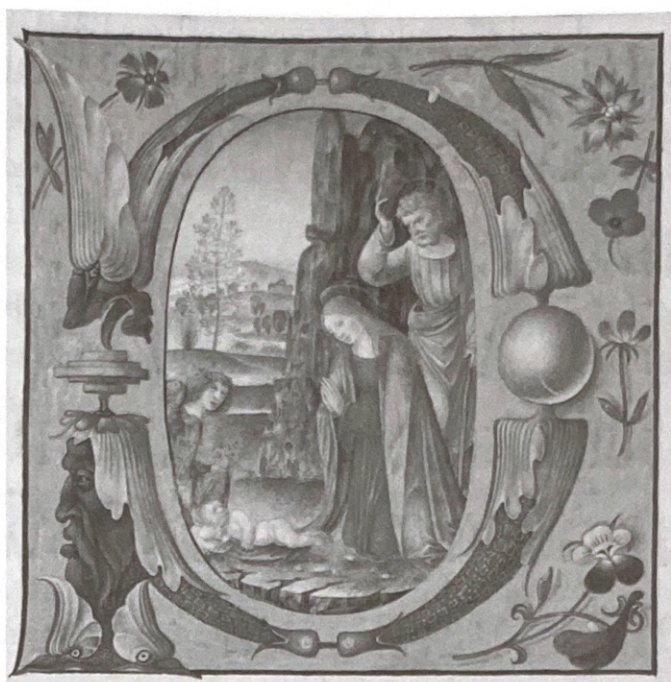
2. Detalle del Misal del Cardenal Merino. Archivo Histórico Diocesano. Catedral de Jaén.

En el siglo XVI se acentúa esta referencia a los modelos italianos como bien ilustra la arquitectura del templo, aunque en las artes plásticas “lo norteño” goce de una gran difusión. La presencia continua en Italia de prelados como el giennense don Esteban Gabriel Merino (1523-1535), don Francisco de Mendoza (1538-1543), don Pedro Pacheco Ladrón de Guevara (1545-1554), entre otros, contribuirá a la consolidación del clasicismo 15 . Merino pasó gran parte de su vida en Italia, donde desempeñó cargos como arzobispo de Bari (1513) y administrador del arzobispado de Gaeta y del obispado de Bovino. Al servicio de Carlos V desarrolló importantes misiones diplomáticas, constituyéndose en uno de sus hombres de máxima confianza por lo que estará presente en su coronación en Bolonia en 1530. Estas razones explican la existencia de diversas obras italianas en el pontifical del prelado, algunas de tanta calidad como el Misal elegido por el cabildo. La realización del mismo se debe a uno de los miniaturistas más afamados de la Italia del momento, Matteo da Milano, que ilumina esta selección de misas, que debió celebrar habitualmente este prelado renacentista, pues no se trata de un misal plenario 16 .