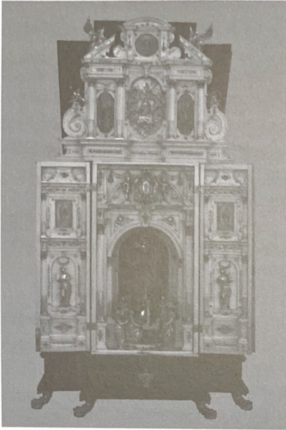
6. Relicario de Santa Cecilia. Exposición Permanente. Catedral de Jaén.