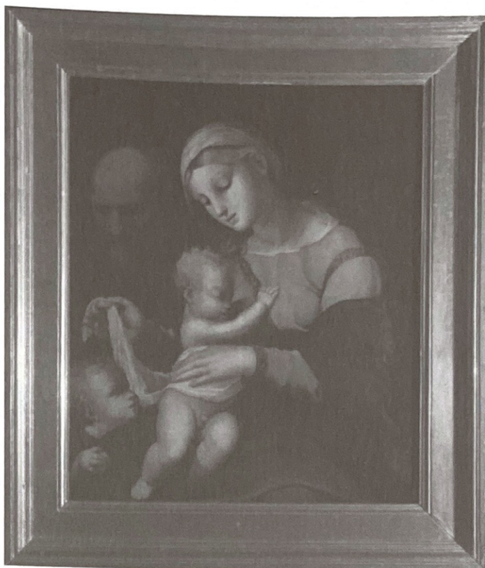
7. Virgen de la Cinta. Exposición Permanente. Catedral de Jaén.

Efectivamente la catedral de Jaén contó con una sólida colección de pintura italiana, donde originales y copias alternaban con obras de artistas españoles que seguían los modelos de aquellas. Entre algunas de las obras más celebradas, junto a las ya citadas de Corbi y Graziani, se encuentran los lienzos de San Agustín y Santo Tomás de Villanueva , actualmente en la Exposición Permanente, cuya autoría es desconocida, aunque existen muchos rasgos que los conectan con las obras realizadas en Roma con motivo de la